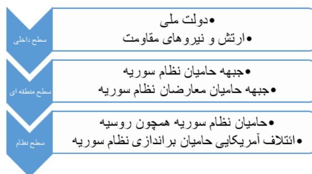
شکل شماره ۲: الگوی سلسله مراتبی بازیگران درگیر در بحران سوریه

از منظر سطح بازیگر، هرچند کنش بازیگران درگیر در این بحران در سطوح مختلفی همچون سطح داخلی (دولت سوریه، ارتش و نیروهای مقاومت، شخصیت‌ها و احزاب سیاسی، معارضین مسلح و ...)، سطح منطقه‌ای (مجموعه اقدامات بازیگران عمده منطقه همچون ایران، عربستان، ترکیه و ...) و نیز سطح نظام (ورود روسیه، ایالات متحده، فرانسه و انگلیس در بحران مذکور) و در دو جبهه کلی موافقان و مخالفان دولت بشار اسد قابل طرح و بررسی است. با این حال، این پژوهش ضمن تأکید بر نقش و تأثیرگذاری دیگر سطوح درگیر در این بحران، تلاش خود را بر نقش بازیگران منطقه‌ای (سطح تحلیل میانی) در روند شکل‌گیری و مدیریت بحران سوریه متمرکز می‌سازد (شکل شماره ۲).