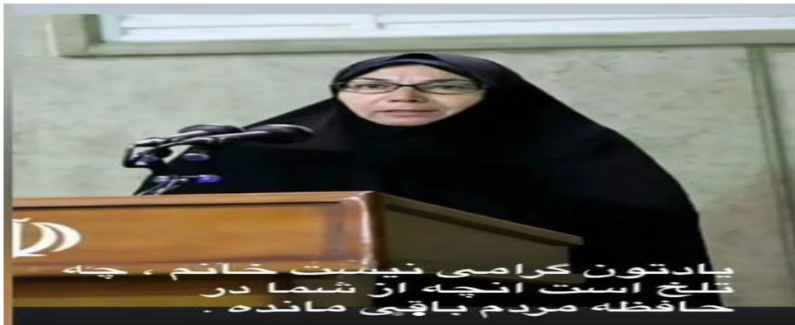
تصویر ۱ پست اینستاگرام بازیگر مرد ایرانی در واکنش به مرگ یک سلبریتی زن دیگر

جریان سیاسی خاص را مورد نقد قرار دهد و همزمان از طریق نفی کارنامه سیاسی و هنری آن سلبریتی، به نمایش دیدگاه خود بپردازد. به عبارت دیگر، از منظر گفتمان زبان‌شناسی این نفی به مثابه تأیید مستتر می‌تواند در نظر گرفته شود. در این چارچوب ارزش‌های مورد نظر سلبریتی مرد منتشر کننده تصویر پروانه معصومی به صورت مستقیم از طریق دیگرسازی از باورها و ارزش‌های مورد احترام سلبریتی دیگری که تصویر او منتشر شده است برای تأیید مخاطبان در معرض نگاه آنان قرار گرفته است. در اینجا دیگری به مثابه فردی در نظر گرفته می‌شود که از نظر هویتی در چارچوب گروه ما قرار نمی‌گیرد. دیگری همواره از نظر هویتی، سبک زندگی ارزش‌ها و رویکردها در نقطه مقابل ما قرار می‌گیرد. از همین رو تأکید بر تفاوت و تمایز او است که نشان دهنده آن است که در اینجا ارزش‌های دیگری وجود دارند که باید بر روی آن تأکید داشت. به این ترتیب در اینجا بازنمایی دیگری، روشی برای رسمیت بخشیدن به هویت و اندیشه‌ای است که از آن «ما» قلمداد می‌گردد.