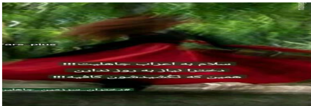
تصویر شماره ۵ واکنش سلبریتی مرد به اخباری در مورد مبارزه با بی‌حجابی

در اینجا شاهد آن هستیم که این فرد نامور برای نمایش رویکرد خود به انتخاب‌های سیاسی‌ای که در جامعه وجود دارد تلاش نموده تا از تصویر زنان بهره‌گیرد و به این ترتیب به نمایش جهت‌گیری سیاسی خود در برابر دو قطبی ایجاد شده در جامعه ایران در حوزه حجاب و سیاست‌های مرتبط با آن پردازد. از این رو، وی از نشانگان فرهنگی، زبانی و تصویری بهره می‌جوید تا نشان دهد که در مواجهه با سیاست‌های تقنینی در حکومت جمهوری اسلامی ایران از یک تمایز با کسانی برخوردار است که حامی حکومت هستند و به نوعی خود را حامی جنبش‌های زنان نشان دهد.