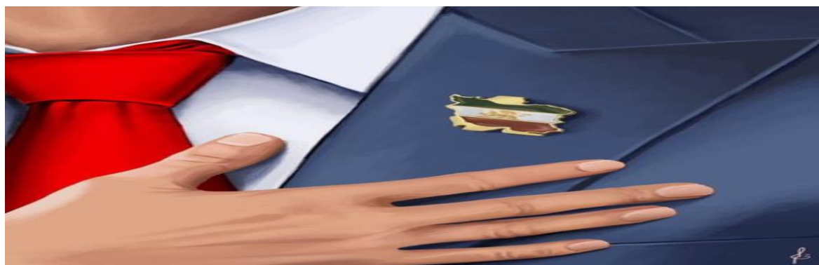
تصویر ۴ عکس نمادین منتشر شده در صفحه سلبریتی مرد در مورد نقش‌آفرینی رضا پهلوی

اما از آنجایی که این اقدام نمایشی از روی عدم تخصص و آگاهی کافی این سلبریتی‌ها از دانش سیاست بود می‌توان در نگاه اول به موضوع پی برد که هیچ یک از دموکراسی‌ها و نظام‌های انتخاباتی در جهان، مسئله نمایندگی از طریق اعطای وکالت را قبول ندارند و فقط بر انتخابات آزادانه و رقابت تأکید دارند. دومین مطلب که در اینجا به شدت نمایان است انتخاب یک