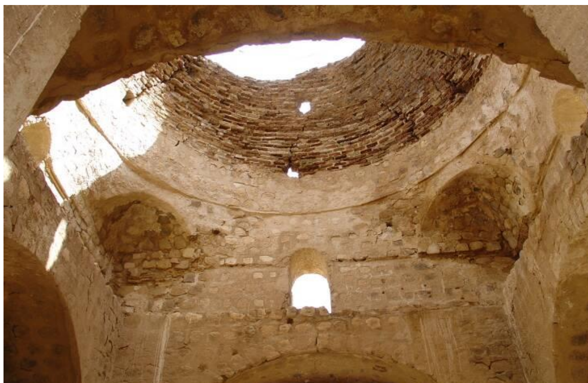
شکل ۷: نمای داخلی قصر سروستان.