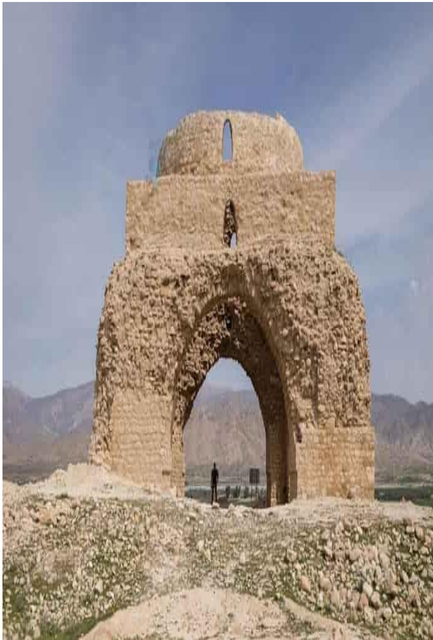
شکل ۵: آتشکده جره.

خواهر بندری و بسطام بود و نام بسطام بنا به روایت مارکواریت در نام شهر بسطام در خراسان مانده است و نیز «بستان» در «طاق بستان» نزدیک کرمانشاه لهجه دیگری از ویستام است و در مجمل‌التواریخ گفته شده است که نام طاق بستان از دهکده بسطام است که از نام گسستم دایی خسرو گرفته شده است (شهبازی، ۱۳۸۹: ۶۱۵).