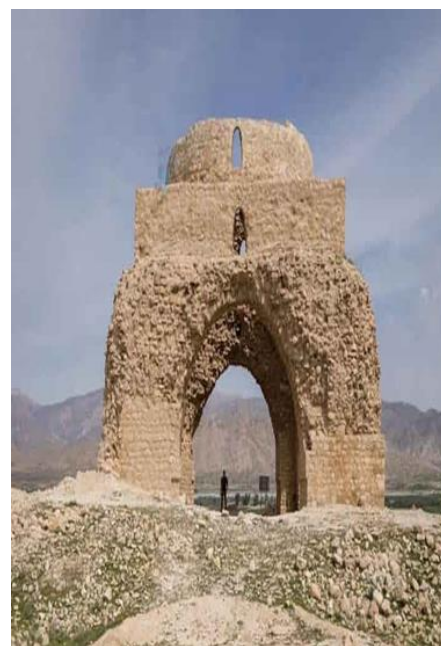
Figure 3: Jareh Fire Temple.