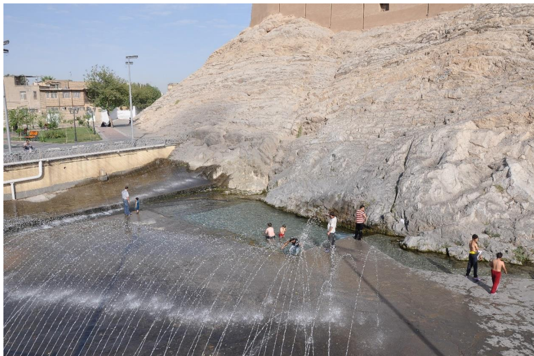
شکل ۲: نهر سورین در شهر ری (تهران) که امروز چشمه علی نامیده می‌شود.

ماهویه: ماهوی سوری نیز از خاندان سورن به شمار آمده است. به گزارش ابن بلخی، ماهویه اصفهبد شهر مرو بود. طبری وی را پسر مافنا، پسر فید و مرزبان مرو می‌داند. او را ملقب به ابراز یا براز می‌خوانند. پس از حمله عرب به ایران، یزدگرد ساسانی به وی پناه برد و او که می‌خواست از این مهمان ناخوانده خلاص شود، نامه‌ای به بیژن فرمانروای سمرقند فرستاد و او را به مرو فراخواند تا یزدگرد را از میان بردارد. یزدگرد چون از توطئه