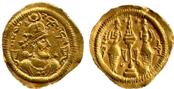
شکل ۳: سکه بهرام چوبین.

علاوه بر افرادی از خاندان مهران که ذکری از آنها به میان آمد، افرادی دیگر از این خاندان مانند بهرام چوبین هستند که در تاریخ ساسانیان نقش زیادی ایفا نمودند (شکل ۳). آثار منسوب به بهرام در ناحیه شهر ری، منطقه‌ای به نام چشمه علی موجود است و کوهی در کنار آن می‌باشد.