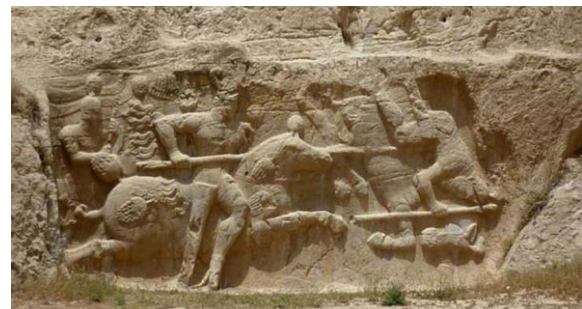
Figure 1: Karen with his Roman helmet, thrown down from the horse by Hormazd II, Naqsh-e Rostam.