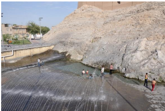
Figure 2: Sorin stream, which today is called Cheshmeh Ali.