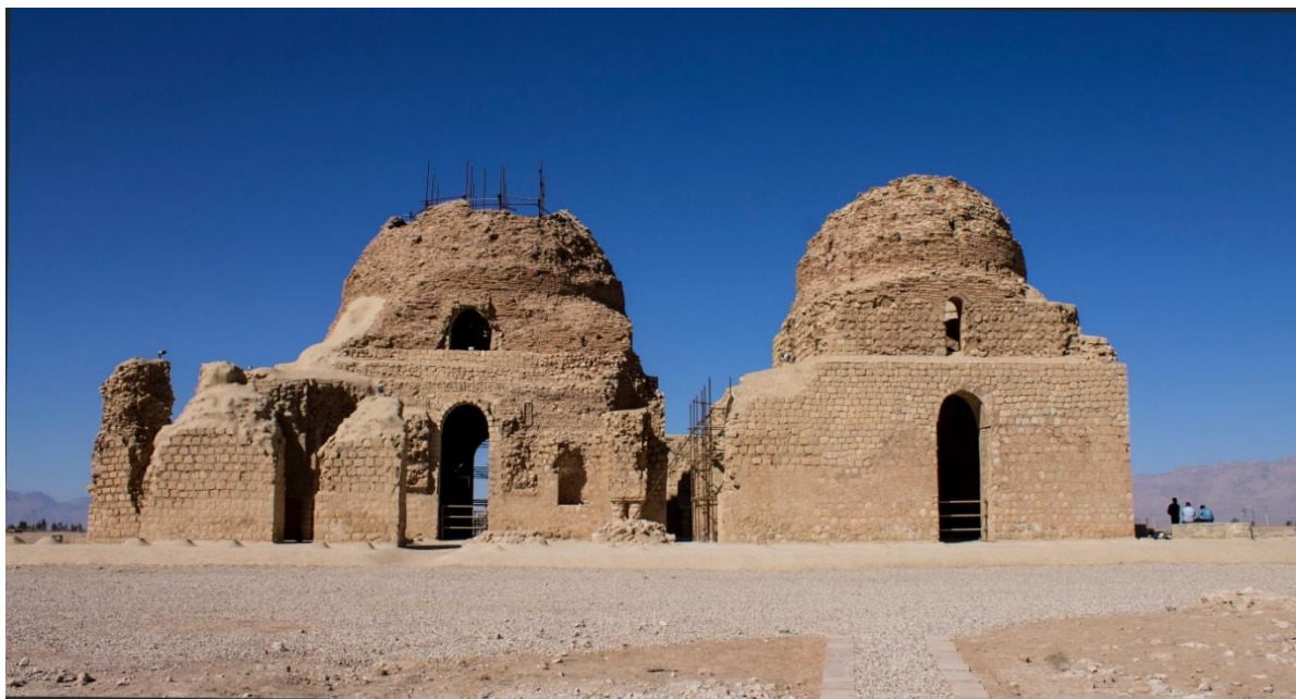
شکل ۶: نمای بیرونی قصر سروستان.