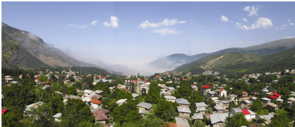
شکل ۲: روستای جواهرده (عکس از نگارندگان، ۱۳۹۱)

در مورد نام این روستا عقاید مختلفی وجود دارد. برخی آن را "جورده" به معنی ده بالا و مرتفع ترین روستای کوهستان برشمرده اند، عده ای آن را به دلیل به دست آمدن آثار قیمتی، طلا و جواهرات در حفاری های به عمل آمده در گذشته "جواهرده" می نامند. جورده واژه ای است مرکب از جور+ ده که در