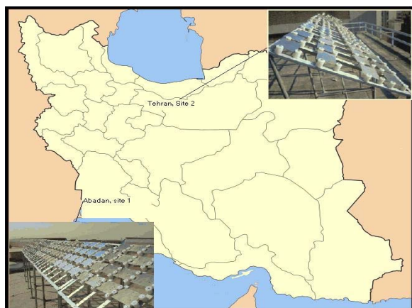
شکل (۱): موقعیت مکانی دو منطقه نمونه گذاری در ایران

جهت بررسی مقایسه ای اطلاعات دو منطقه، برای اندازه گیری کمیت های متفاوت از روش های یکسانی استفاده شد. شکل ۱ محل قرار گیری دو منطقه را روی نقشه ایران نشان می دهد، همچنین این مناطق برای راحتی مراحل بعدی شماره گذاری شده اند.