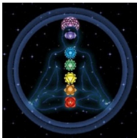
تصویر ۵-۲: محل قرار گرفتن هفت چاکرا در امتداد ستون مهره‌ها

«افرادی که دارای دید اوریک (توانایی دیدن اورا) هستند، این نقاط را به صورت صفحات نوری مشاهده می‌کنند» (همان: ۲۲). «اگرچه تمام طیف‌های رنگی در هر چاکرا وجود دارد، اما تنها یک رنگ بر هر کدام غالب است و این رنگ‌ها به ترتیب از چاکرای قاعده‌ای به تاجی، با هفت رنگ طیف نور؛ یعنی آن چه که در رنگین کمان می‌بینیم، مطابقت دارد: قرمز، نارنجی، زرد، سبز، آبی، نیلی و بنفش. «در بالای چاکرای تاجی، سه چاکرای برتر قرار دارد که دانسته‌های ما درباره آن‌ها اندک است، اما با قایل شدن به وجود آن‌ها و کار کردن با آن‌ها طی مراقبه، می‌توان اطلاعاتی در مورد آن‌ها به دست آورد. اولین مرکز، رنگ اناری از خود ساطع می‌کند. دومی، نور سفید خالص (ضمیر الهی) و سومین یا چاکرای نهایی، رنگ سیاه دارد. همان سیاه مقدسی که همه چیز را در بر می‌گیرد و همه چیز از آن تجلی می‌یابد» (همان: ۲۴).