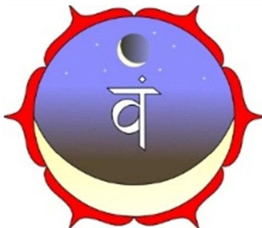
تصویر ۵-۴: چاکرای خاجی یا سوادیست‌هانا

معنای تحت‌اللفظی این چاکرا، محلّ اقامت شخص است و وسط حدّ فاصل شرمگاه و ناف واقع است و سمبل آن یک نیلوفر آبی هلوئی رنگ با شش گلبرگ است که از خود رنگ هلوئی ساطع می‌کند. درون آن گلبرگ‌ها هلال ماه قرار دارد. هلال سفید مظهر ماه، سمبل گیرندگی زن و با عنصر آب در ارتباط است. این مرکز توسط ماه اداره می‌شود. عشق و عقل به عنوان کیفیت تابشی آن شناخته می‌شوند. این مرکز با مسایل جنسی در ارتباط است و تا سنین بلوغ بیدار نمی‌شود. پس از نیروی حیات متعلق به چاکرای قاعده‌ای، انرژی جنسی پر قدرت‌ترین انرژی در انسان است. این مرکز با پنجمین چاکرای اصلی یعنی چاکرای گلو پیوند دارد. با به جا آوردن بعضی مناسک عرفانی، انرژی جنسی با تغییر ماهیت از این مرکز به مرکز گلو انتقال می‌یابد و برای ایجاد خلاقیت و ارتباط مورد استفاده قرار می‌گیرد (ویلز، ۱۳۹۰: ۸-۲۷).