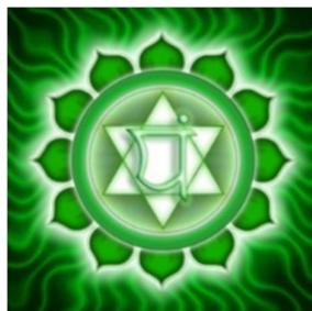
تصویر ۵-۶: چاکرای قلب یا آناهاتا

«آناهاتا به معنی ضربه نخورده است. تمام اصوات دنیا از برخورد اجسام با یکدیگر تولید می‌شوند. این امر باعث ایجاد ارتعاشات یا امواج صوتی می‌گردد. صورت ازلی آمده از ورای این جهان یا همان آناهاتا منشأ همه اصوات است. این مرکز محلی است که صوت آشکار می‌شود و راه به سوی شعور برتر آغاز می‌گردد» (ویلز، ۱۳۹: ۳۴). این چاکرا بین چهارمین و پنجمین مهره سینه‌ای قرار دارد و یک نیلوفر آبی سبزرنگ با دوازده گلبرگ سمبل آن است. در مرکز این گل، ستاره‌ای شش‌پر همانند ستاره داوود، قرار گرفته است. «دو سه گوشه در هم فرو رفته در میان نماد آناهاتا، سمبل اتحاد خدایان نر و ماده، (شیوا (Shiva) و شاکتی (Shakti) است و در اصطلاح روان‌شناسی نماد وحدت اضداد است؛ یعنی وحدت دنیای شخصی فناپذیر «من» با دنیای غیر شخصی فناپذیر «غیر من» که این اتحاد هدف غایی تمام ادیان است، یعنی وحدت روح با خدا. این دو سه گوشه در هم فرو رفته، یک مفهوم مشابه ماندالاهای متداول‌تر را نیز دارند، بدین معنا که آن‌ها بیانگر وحدت و تمامیت «روان» یا «خود» در برگیرنده خود آگاه و ناخود آگاه هستند» (یونگ، ۱۳۸۶: ۳۶۸).