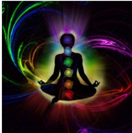
تصویر ۵-۱: طرحی نمادین از اورا

مطالعات نشان می‌دهد که یک منطقه الکترومغناطیسی، پیرامون بدن هر فرد را احاطه می‌کند که «هاله» یا «اورا» نام گرفته است. «اورا، انباشته از الگوهای انرژی است که سلامت بدن فرد را تعیین می‌کند و حاوی رنگ‌هایی است که نسبت به وضعیت خلقی و سلامتی، دایم در تغییر است. این رنگ‌ها در نزدیکی سطح بدن از تراکم زیادی برخوردار است و به تدریج با پیشروی به سمت حاشیه بیرونی هاله، رقیق و رقیق‌تر می‌شود. درخشندگی این رنگ‌ها بستگی به میزان تعالی و پیشرفت روح دارد. در یک جوان، گستره پهنی از نور قرمز در اطراف پاها و گستره باریکی از نور اناری-سفید پیرامون سر وجود دارد. به تدریج با بالغ شدن فرد، تراکم نور قرمز، رنگی که فرد را به سیاره زمین پیوند می‌دهد، کاهش می‌یابد و هم‌زمان گستردگی رنگ‌های روحی اناری و سفید جایگزین آن می‌گردد. هنگام فرارسیدن موعد مرگ و انتقال روح، رنگ قرمز عملاً محو گشته و اورا در این زمان آکنده از انوار اناری و سفید می‌شود» (ویلز، ۱۳۹۰: ۱۸).