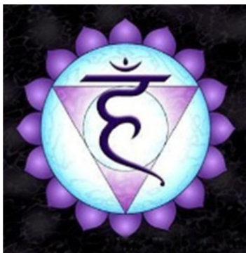
تصویر ۵-۷: چاکرای گلری یا ویشودها

دوستانی جدید با عقاید مشابه می‌کند. با بیدار شدن این مرکز، استعداد ارتباط ذهنی و اطلاع از گذشته، حال و آینده در فرد تجلی پیدا می‌کند» (ویلز، ۱۳۹۰: ۹-۳۷).