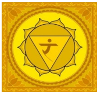
تصویر ۵-۵: چاکرای شبکه خورشیدی یا مانی پورا

این چاکرا هم از نظر رنگ و هم ستاره مرتبط با آن، با افسانه دختر پادشاه اقلیم دوم یعنی روز یک‌شنبه هماهنگی دارد.