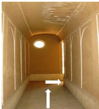
شکل ۲- برای ورود به خانه و تأمین محرمیت باید از دالان غیر مستقیم روبرو گذشت؛ درون خانه به هیچ وجه قابل رؤیت نیست (مأخذ: نگارندگان)

با روش های گوناگونی صورت می گرفته است، یکی دیگر از این روش ها، نحوه طراحی فضای ورودی به گونه ای است که هدف یا هدف های لازم را در چگونگی ایجاد ارتباط بین یک فضا با فضاهای پیرامون تأمین نماید. همان گونه که در قبل هم اشاره گردید در خانه ها به دلیل این که نمی خواستند شخص نامحرم از جلوی فضای ورودی به داخل خانه دید داشته باشد و نیز برای تأمین حداکثر محرمیت و در برخی از شهرها و دوره ها برای تأمین حداکثر محرمیت سعی می کردند مسیر حرکت در داخل فضای ورودی را تا حد امکان طولانی و غیر مستقیم نمایند (شکل شماره ۲).