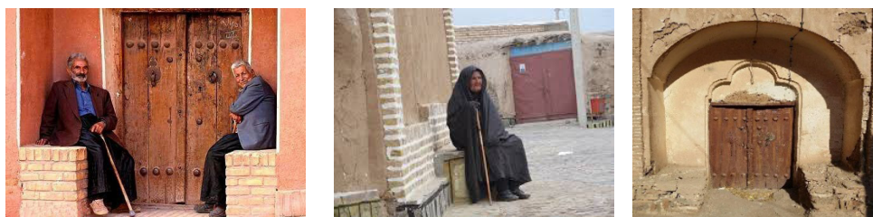
شکل ۴- خواجه‌نشین‌ها (پیرنشین) فرصتی برای حضور اجتماعی زنان در حریم خانه

برخی از اجزای فضاهای ورودی مانند صحن جلو خان، پیش طاق و هشتی، محل نشستن افراد و تجمع‌های کوچک و گاه بزرگ زنان و نیز برای برگزاری برخی مراسم بود. علاوه بر آن، در هر یک از دو سمت پیش طاق بسیاری از انواع بناهای خانه‌های سنتی خواجه نشیمنی ساختند که محل نشستن چند نفر بود. نشستن بر روی این سکوها و گفتگو برای انجام کارها یا گذران اوقات، یکی از الگوهای رفتاری زنان در گذشته بوده است. سکو عنصری است که عموماً به صورت زوج در دو سوی پیش طاق بسیاری از خانه‌ها ساخته می‌شده است. از این عنصر برای نشستن در جلوی یک خانه هنگام انتظار برای شخصی یا برای رفع خستگی استفاده می‌کردند (شکل شماره ۴).