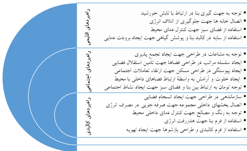
شکل ۳- شاخصه‌های طراحی مسکن چند واحدی (پلکس) با بهره‌گیری از الگوهای معماری بومی اقلیم گرم و خشک

پس از مطالعه مسکن بومی و پلکس، برای ارزیابی خصوصیات و ویژگی‌های این دو نوع مسکن در قالب سه بعد اقلیمی، اجتماعی و پایداری دسته‌بندی شده و انطباق‌پذیری شاخصه‌های این دو نوع مسکن مورد ارزیابی قرار گرفت. ۱۶ شاخصه‌ی مشترک در این دو نوع مسکن دیده می‌شود که البته، علت وجودی آن‌ها متفاوت است. مسکن بومی متأثر از مؤلفه‌های اقلیمی، فرهنگی و معیشتی است، اما مسکن پلکس حاصل شیوه‌ها و نگرش‌های جدید زیستی و اجتماعی است. ولی باوجود ریشه‌های متفاوت مسکن بومی و پلکس، می‌توان ویژگی‌های مشترکی در آن‌ها پیدا کرد. این معیارها نشان می‌دهد که مباحث مربوط به اصول پایداری اقلیمی جزء مباحث مهم و اساسی در زمینه طراحی معماری بومی می‌باشند که در مسکن پلکس تحقق یافته است. مسکن پلکس دارای جنبه‌های مثبت مجتمع‌های زیستی می‌باشند و از سویی دیگر صرفه‌جویی مصرف انرژی و همسویی با طبیعت را سرلوحه خود قرار می‌دهند که در انطباق با مسکن بومی اقلیم گرم و خشک می‌باشد. البته سه تفاوت در این دو نوع مسکن در جدول دیده می‌شود که علت آن بحث فناوری در روش‌های ساخت‌وساز است. مباحث مربوط به مسکن بومی در ارتباط با اصول پایداری اقلیمی جزء مباحث مهم و اساسی در زمینه طراحی معماری می‌باشند. معیارهای بررسی شده نشان می‌دهد که پلکس‌سازی تأکید بسیاری بر شرایط اقلیمی زندگی پایدار دارد و با این حال، این محیط