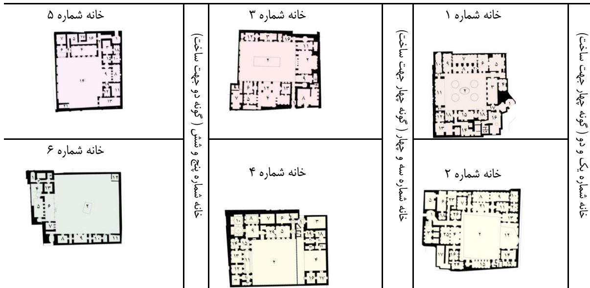
جدول ۳- نمونه‌های مطالعاتی مسکن بومی کرمان

ارزیابی شاخصه‌های معماری بومی در مسکن بومی شهر کرمان ویژگی‌های حاصل از شناخت معماری بومی اقلیم گرم و خشک در (جدول ۴) مورد ارزیابی قرار گرفته است.