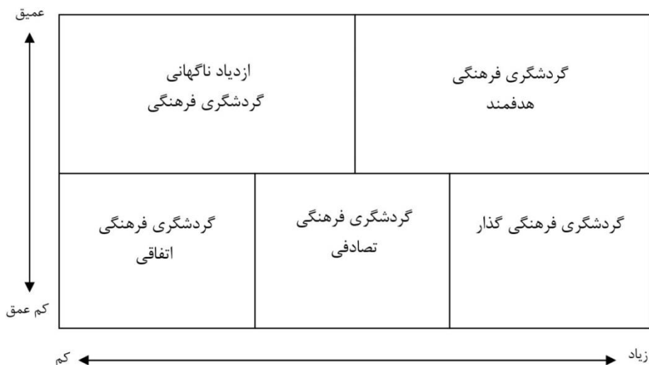
اهمیت گردشگری فرهنگی در تصمیم برای بازدید از یک مقصد شکل ۳. گردشگری فرهنگی (مک کرچر و دوکروس، ۲۰۰۳)

مرور ادبیات موضوع و تحقیقات انجام‌شده نشان می‌دهد که در سال‌های اخیر توجه فزاینده‌ای به موضوع گردشگری شهری شده است؛ با این حال، بیشتر مطالعات از منظرهای کالبدی، مدیریتی یا اقتصادی به این پدیده پرداخته‌اند و بعد فرهنگی آن، خصوصاً در بستر شهر اصفهان و با رویکرد کیفی، کمتر مورد توجه قرار گرفته است. پژوهش حاضر از این جهت نوآورانه است که با تمرکز بر فرهنگ گردشگری شهری و با بهره‌گیری از روش‌شناسی کیفی گراند تئوری، در پی ارائه مدلی برای بهبود فرهنگ گردشگری در شهر اصفهان در افق ۱۴۰۳ است.