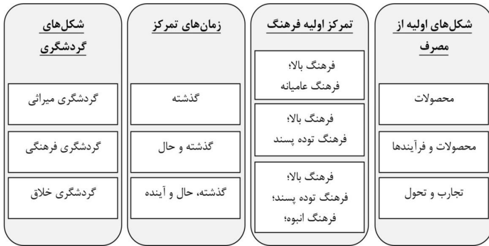
شکل ۱. ویژگی‌های گردشگری فرهنگی در کنار میراث فرهنگی و گردشگری خلاق (موسوی و باقری کشکولی، ۱۳۹۲)