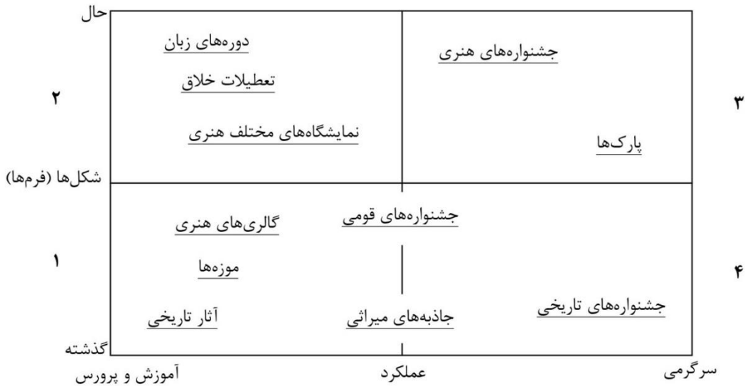
شکل ۲. گونه شناسی از جاذبه‌های گردشگری فرهنگی (ریچاردس، ۲۰۰۱)

در زمینه محصولات گردشگری فرهنگی، هرچه دیدگاه‌ها بیشتر به سوی تمرکز بر تولید و ارائه کالاهای خاص فرهنگی متمایل شوند، به همان میزان امکان معرفی و توسعه گردشگری فرهنگی افزایش می‌یابد. در واقع، گردشگری پدیده‌ای فرهنگی است که در بستر آن، در یک مکان مشخص، تعامل‌ها و تبادل‌های فرهنگی میان گردشگر و جامعه میزبان شکل می‌گیرد. این فرایند به‌طور مستقیم با انسان، انگیزه‌ها، نیازها، خواسته‌ها و آرزوهایی که ریشه در فرهنگ جامعه دارند، در ارتباط است (رضائی و قاسمی، ۲۰۲۲).