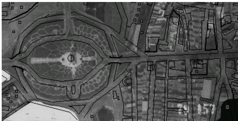
شکل 1- نمونه‌ای از قرار دادن لایه رقومی بر روی عکس (میدان آزادی)

calculations) موجود به صورت خودکار توسط نرم افزار محاسبه شد. عکس‌ها نیز به ترتیب با استفاده از لایه رقومی ارتفاع منطقه تا سطح ortho تصحیح شدند. برای بررسی دقت تصحیحات پس از اتمام کار لایه رقومی راه‌های منطقه بر روی عکس قرار گرفته و میزان خطا در بخش‌های مختلف عکس بررسی گردید که در تمام عکس‌ها میزان جابجایی بسیار ناچیز و دقت تصحیحات قابل قبول بوده است. نمونه‌ای از این عمل در شکل‌های 1 و 2 نشان داده شده است.