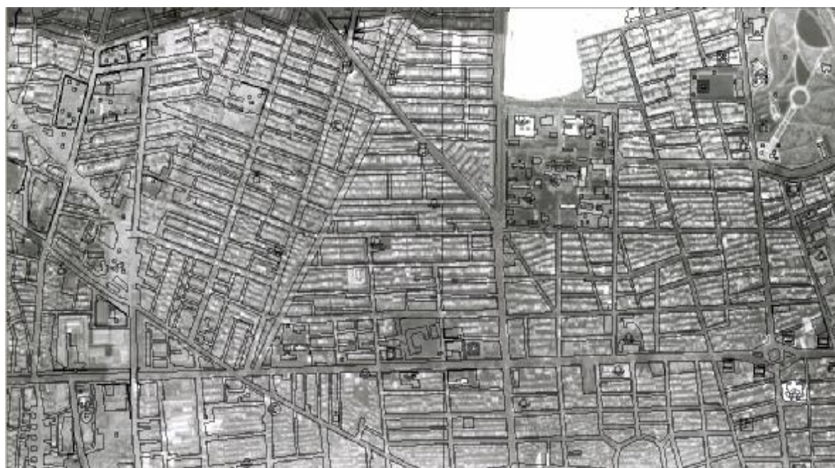
شکل 2- نمونه‌ای از قرار دادن لایه رقومی بر روی عکس (منطقه ستارخان)