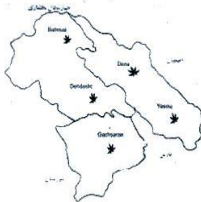
شکل 1 - پراکنش گونه بنه در استان کهگیلویه و بویر احمد

منطقه مورد مطالعه در محدوده جنگل‌های گردنه ماه پرویز یاسوج در دامنه ارتفاعی بین 1850 تا 2600 متر از سطح دریا و بین دو مدار 51 درجه و 40 دقیقه تا 51 درجه و 45 دقیقه طول شرقی و 30 درجه و 30 دقیقه تا 30 درجه و 35 دقیقه عرض شمالی قرار گرفته است. شکل 1 پراکنش گونه بنه را در استان کهگیلویه و بویر احمد نشان می‌دهد. بر اساس اطلاعات ایستگاه هواشناسی شهرستان یاسوج حداکثر و حداقل دما به ترتیب 38 و -10 درجه سانتی‌گراد و متوسط آن 15/4 درجه سانتی‌گراد است. حداکثر و حداقل بارندگی به ترتیب 1020 و 325 میلی‌متر و میانگین آن 623/8 میلی‌متر است. بافت خاک منطقه از نوع رسی - سیلتی و لومی - رسی بوده که بر روی سنگ‌های آهکی تشکیل شده‌اند و PH خاک بین 7/6 تا 8/8 در نوسان است (غفاری 1373).