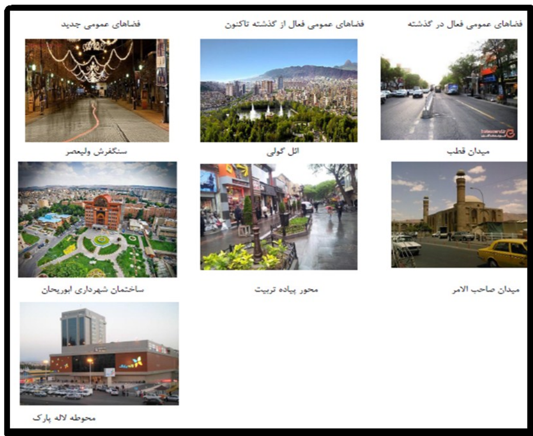
شکل شماره (۲): تصاویر انواع فضاهای عمومی مورد مطالعه

عمومی که با توجه به سابقه تاریخی خود جدیداً شکل یافته‌اند) قرار می‌گیرند انتخاب و شاخص‌های سرزندگی را برای این فضاها بررسی نماید. در واقع سعی بر آن بوده فضاهای عمومی انتخاب و بررسی شوند که بیشترین سهم را در جذب شهروندان در گذشته و حال داشته‌اند که از این میان می‌توان به میدان تاریخی قطب و صاحب‌الامر اشاره کرد که بر اساس سوابق تاریخی خود در گذشته محل تجمع شهروندان بوده ولی در حال حاضر این ویژگی در این فضاها کمرنگ شده است. همچنین سعی گردیده فضاهای عمومی مورد مطالعه قرار گیرند که از گذشته تاکنون قابلیت جذب شهروندان را حفظ کرده‌اند که از آن جمله می‌توان به پیاده راه تربیت و پارک ائل‌گولی اشاره نمود و در دسته دیگر سعی گردیده نمونه‌هایی از فضاهای عمومی انتخاب گردند که از نظر سابقه تاریخی جدیداً شکل یافته‌اند و در حال حاضر سهم قابل توجهی را در جذب شهروندان داشته‌اند که از آن جمله می‌توان به مجتمع لاله پارک، محوطه شهرداری مرکز و سنگفرش ولیعصر اشاره نمود.