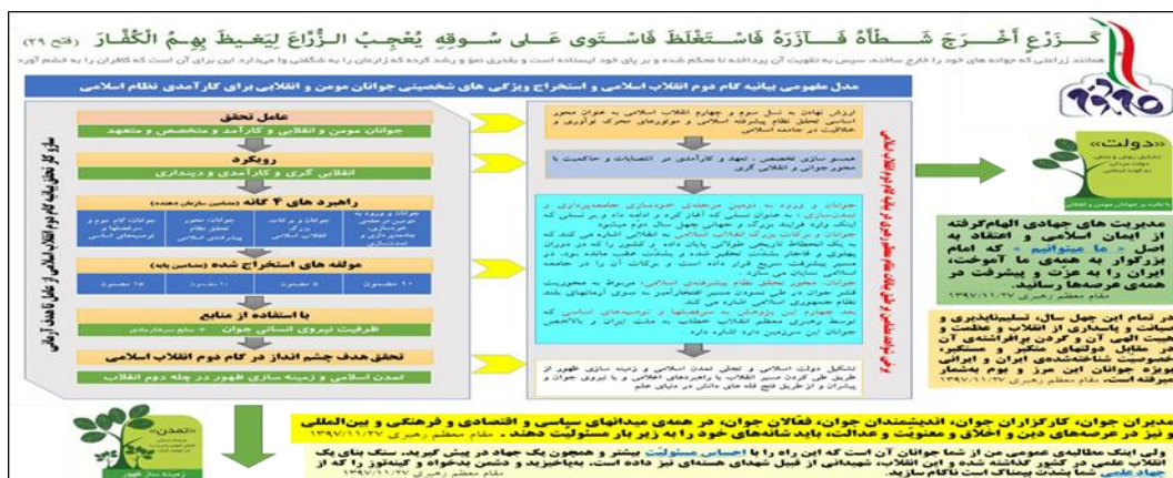
شکل ۱- مدل مفهومی بیانیه گام دوم انقلاب اسلامی و استخراج ویژگی‌های شخصیتی جوانان مؤمن و انقلابی برای کارآمدی نظام اسلامی