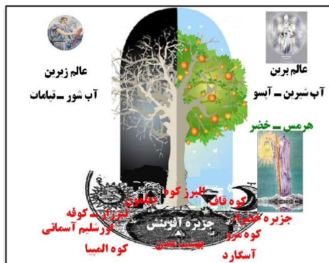
شکل ۳. موقعیت فرضی مجمع البحرين یا جزیره آفرینش

چنانکه دیده می‌شود، مجمع‌البحرین و اعراف و کوه قاف، هر سه اشاره به مقام و جایگاه خضر دارد. موقع برزخی مجمع‌البحرین و اعراف که یکی به ملتقای دو دریا و دیگری به جایی در میان بهشت و دوزخ اشاره دارد، به خوبی مفهوم آن‌ها را با عالم مثال یا وسیط هم‌هنگ می‌کند. کوه قاف که همان کوه «هَرَه بره زئیتی» اوستایی است نیز نامی برای عالم وسیط است...» (پور نامداریان، ۱۳۶۸: ۲۷۲).