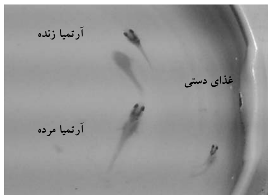
شکل ۲- تفاوت در اندازه لاروهای سه تیمار آزمایشی

• حروف مشابه در هر ستون نشان‌دهنده عدم وجود اختلاف آماری بین تیمارهای می‌باشد.