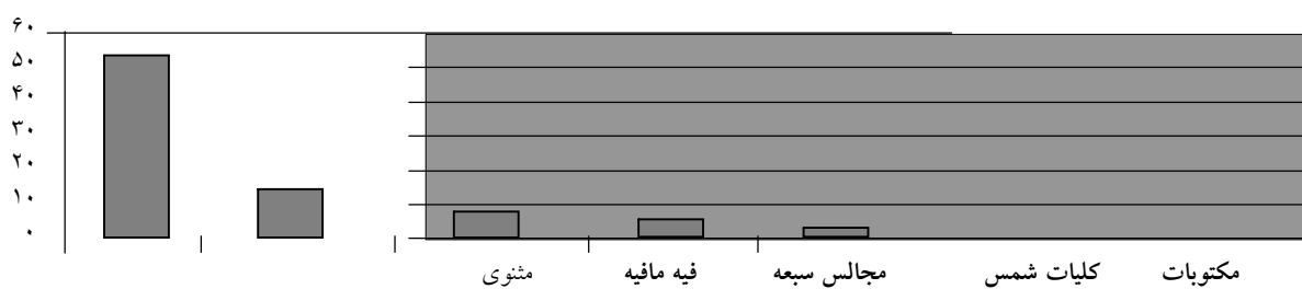
نمودار 1- فراوانی حکایات صوفیه در آثار مولوی

با قبول این معیارها، در کل آثار مولوی 73 حکایت صوفیه وجود دارد (17) . مثنوی: 53 حکایت، فیه ما فیه: 12 حکایت، مجالس سبعة: 4 حکایت، کلیات شمس: 3 حکایت، مکتوبات: 1 حکایت.