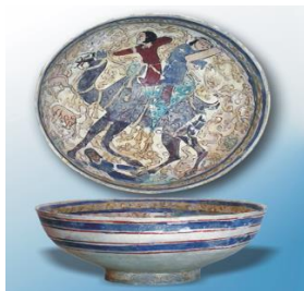
تصویر شماره ۱: کاسه مینایی منقوش به داستان بهرام و آزاده

کاسه سفالین مینایی موزه مراغه با نقش بهرام و آزاده با رنگ‌های گوناگونی تصویر شده که طرح‌های بسیار زیبای نقش را جلوه‌ای دوچندان داده است. در این کاسه سفالی مینایی نقش بهرام و آزاده بر روی شتر تصویر شده و نقش دیگری از آزاده نیز در زیر پای شتر تصویر گردیده است و سایر تصاویر که به طور یکرنگ در زمینه نقش شده‌اند، همگی تک‌رنگ و به صورت برجسته کار شده است که نمونه‌های آن کمتر دیده شده است. (تصویر شماره ۱)