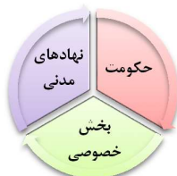
شکل ۴: مشارکت مردمی بر مبنای الگوی سه‌وجهی حکمرانی خوب

واکاوی مفهوم حکمرانی نشان از گستردگی مفهومی آن دارد، به نحوی که همه نوع شکل‌های حکمرانی نظیر حکمرانی شرکتی، محلی، ملی (دولت، جامعه مدنی و بخش خصوصی) و بین‌المللی را شامل می‌شود (دانایی‌فرد و همکاران، ۱۳۹۱: ۴۹؛ Gowda & Kumar, 2013: 83). حکمرانی خوب به‌عنوان یک موضوع نوپیدا، از حیث ساختار دو جنبه دارد. یکی این که بر نقش مشارکتی مردم در حکمرانی تأکید می‌کند و دیگر این که الگوی مشارکت را بر مبنای یک الگوی سه‌وجهی از «حکومت»، «بخش خصوصی» و «نهادهای مدنی» ارائه می‌کند که هر کدام نقش و وظایفی بر عهده دارند (زهیری، ۱۳۹۷: ۶۵). الگوی حکمرانی مشارکتی سه بخش دولتی، خصوصی و مدنی در حکمرانی فضای مجازی، با مدیریت و اداره راهبردی حکومت همراه با نظارت همگانی، مطلوب‌ترین سبک حکمرانی فضای مجازی است. در این شیوه از حکمرانی فضای مجازی، حکومت‌ها و دولت‌ها در مقیاس ملی با تدوین سیاست‌های کلان خود اقدام به سیاست‌گذاری و تعیین خط‌مشی‌های کلی می‌نمایند. در سطحی پایین‌تر بخش‌های دولتی، خصوصی و مدنی برنامه‌ریزی جهت مدیریت و بهره‌برداری از فضای مجازی را به صورت مشارکتی بر عهده دارند. همچنین هر سه بخش مذکور با نظارت همگانی، باعث جلوگیری از هرگونه فساد در این فضا می‌شوند. در الگوی حکمرانی مشارکتی، بخش دولتی تهیه کننده و ابلاغ کننده شیوه‌نامه‌های مدیریتی و اجرایی در فضای مجازی است. بخش خصوصی با همکاری دولت و بخش مدنی، سخت‌افزارها و نرم‌افزارهای فضای مجازی را تولید و توزیع می‌کنند.