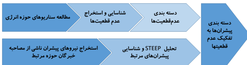
شکل ۱- چارچوب فرآیندی پیشنهادی شناسایی عدم قطعیت‌ها و پیش‌ران‌ها

به منظور شناسایی و استخراج عدم قطعیت‌ها و پیش‌ران‌ها در حوزه‌های متفاوت چارچوب مفهومی شکل