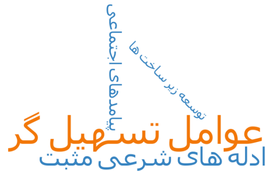
شکل ۴: نمای ابری مولفه‌ها، زیر مولفه‌ها عوامل تسهیل‌گر چالش‌های حضور بانوان در ورزشگاه‌های ایران

با اشاره به شکل ۳ و شکل ۴ که خروجی نهایی نرم‌افزار است، عوامل تسهیل‌گر چالش‌های حضور بانوان در ورزشگاه‌های ایران نشان داده شده است که با توجه به ضخامت خط‌ها، اهمیت و میزان تکرار هر کدام از مولفه‌ها از دیدگاه مصاحبه‌شوندگان مشخص شده است.