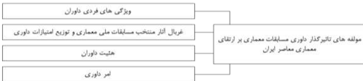
شکل ۳. دسته بندی مؤلفه‌های تأثیرگذار داوران مسابقات معماری بر ارتقای معماری معاصر ایران (نگارندگان، ۱۴۰۲)

پرسش‌نامه توزیع شده بین خبرگان، این امکان را برای آنان فراهم آورد که نظر خود را راجع به اهمیت مؤلفه‌ها و زیرمؤلفه‌ها در درجات اهمیت مختلف بیان نمایند؛ به گونه‌ای که از میان ۵۰ عامل تفکیک شده و با آزمون آن‌ها، تعداد ۳۳ زیرمؤلفه و ۴ مؤلفه اصلی به عنوان پایگاه اطلاعاتی و عوامل تأثیرگذار داوران