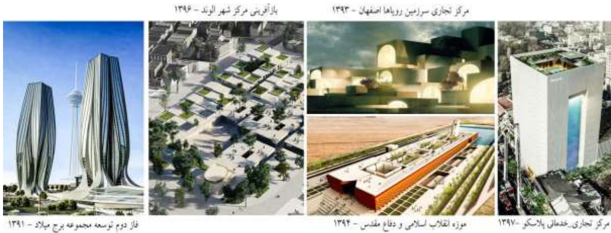
شکل ۲. تصاویر تعدادی از طرح‌های رتبه نخست در مسابقات معماری دهه ۱۳۹۰ ایران (وب سایت معمار نیوز، ۱۴۰۲)

مسابقات ملی معماری بر ارتقای معماری معاصر ایران در دهه ۱۳۹۰ شناخته شد. این ۴ مؤلفه اصلی عبارتند از ویژگی‌های فردی داوران، غربال آثار منتخب مسابقات ملی معماری و توزیع امتیازات داوران، هیئت داوران و امر داوران (شکل ۳). سطح معنی‌داری برای این معیارها به ترتیب ۰/۰۶۵، ۰/۰۶۹، ۰/۰۸ و ۰/۵۳ به دست آمده است و بیانگر این است که معیارهای پژوهش نرمال هستند.