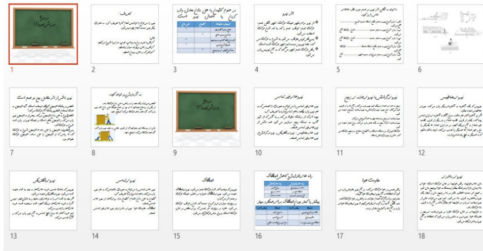
شکل ۲: ارائه خطی و نرم افزار PowerPoint (نمونه ی استفاده شده)

با توجه به مطالبی که در بالا ذکر شد می توان اظهار داشت که ارائه شبکه‌ای در مقایسه با ارائه خطی بر پیشرفت تحصیلی علوم تجربی ششم ابتدایی موثر است. این پژوهش بر آن است که این ادعا را مورد بررسی قرار دهد. بنابراین سوال اصلی پژوهش مورد نظر این است: آیا ارائه شبکه‌ای در مقایسه با ارائه خطی بر پیشرفت تحصیلی علوم تجربی ششم ابتدایی اثر بخش است؟ به این منظور ۳ فرضیه مورد مطالعه قرار گرفت که ارائه شبکه‌ای در مقایسه با ارائه خطی بر پیشرفت تحصیلی مفاهیم علوم تجربی ششم ابتدایی (داداری، درک و کاربری) موثر است که در قسمت یافته ها به آنها اشاره شده است.