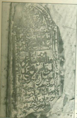
لوحة رقم ( ۵۳ ) : نقش رباط رامیشت بن الحسین المؤرخ بعام ۵۲۹ هـ - متحف آثار الحرم المکی الشریف