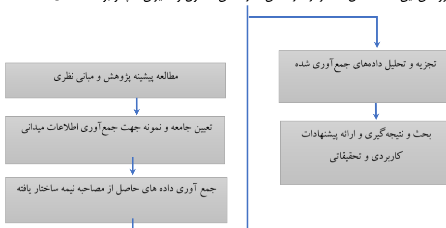
شکل ۱. شمای کلی از مسیر تحقیق

نمونه گیری به صورت گلوله برفی انجام شده که ابتدا تعداد کمی از افراد که دارای ویژگی‌ها و یا تجربیات خاصی بودند انتخاب شدند، سپس از آنها خواسته می‌شود که کاندیدای دیگری با ویژگی‌ها و تجربیات مشابه را معرفی کنند. این عملیات تا رسیدن به حد مطلوب تعداد نمونه (اشباع) که در این پژوهش این تعداد شامل ده نفر از کارشناس، کارشناس مسئول و مدیران ساپکو بودند، ادامه یافت.