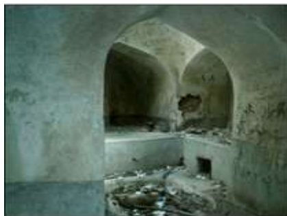
تصویر شماره دو و شماره سه (نگارنده، ۱۳۹۱)