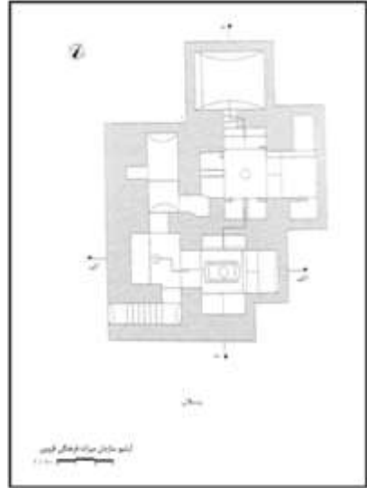
شکل شماره یک (آرشیو سازمان میراث فرهنگی قزوین) شکل شماره دو (آرشیو سازمان میراث فرهنگی قزوین)