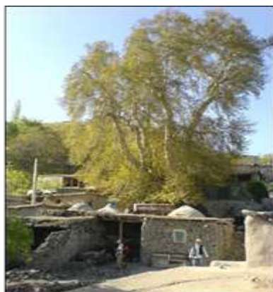
تصویر شماره چهار (نگارنده، ۱۳۹۱)