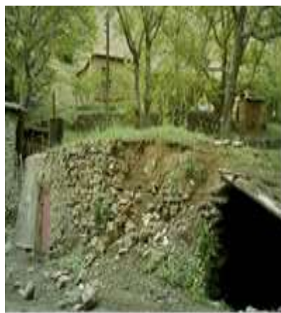
صویر شماره شش