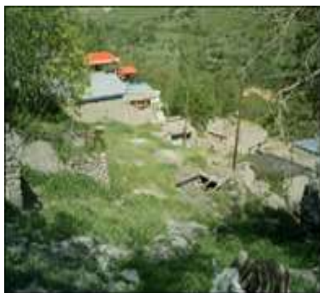
تصویر شماره پنج (نگارنده، ۱۳۹۱)