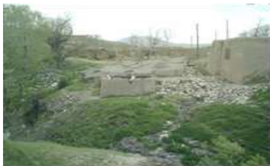
تصویر شماره یک (نگارنده، ۱۳۹۱)

بطور کلی و خلاصه ویژگی‌های مشترک حمامهای منطقه، علاوه بر مردم‌واری، پرهیز از بیهودگی و نیارش عبارتند از بوم‌آور بودن مصالح بکار رفته در بناها از جمله سنگ رودخانه‌ای که با توجه به اقلیم منطقه و وجود رودخانه‌های دائمی و فصلی متعدد به وفور یافت می‌شود. نوع پوشش سقف که به صورت گنبد‌های کلبه‌بوده و هورن‌های مرکز آنها جهت تأمین نور داخل بناها. وجود سکوه‌های متعدد در دهلیز، بینه و گرمخانه و طاق‌های جناقی با عمق متفاوت. استفاده از اندود دیمه در گذشته در داخل بنا و جایگزین شدن ملات سیمان در اقدامات مرمتی بناها. ضمن اینکه در هیچ یک از حمامهای مورد بررسی، اثری از تزئینات داخلی و یا خارجی به چشم نمی‌خورد.