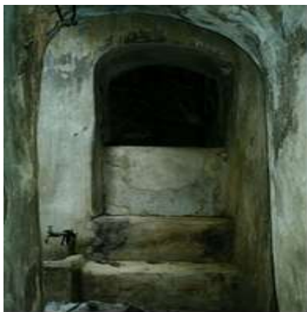
تصویر شماره هفت (نگارنده، ۱۳۹۱)