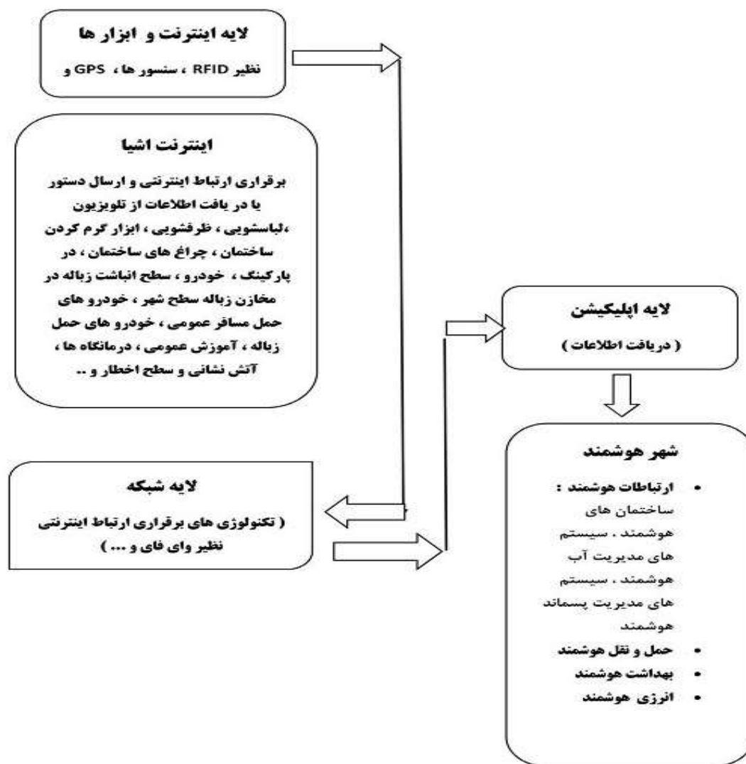
شکل ۲: لایه‌های یک شبکه اینترنت اشیا ۳ لایه‌ای برای جمع‌آوری پسماندهای شهری

معماری اینترنت اشیا، نیاز به پشتیبانی از یک مدل معماری مرجع بسیار مهم است. بسیاری از مدل‌های پروژه بر روی یک معماری معمولی مبتنی بر تجزیه و تحلیل نیازها یا بر روی برخی لایه‌ها متمرکز شده‌اند که الگوی اساسی معماری مرجع را تشکیل می‌دهند. حتی با یک معماری انعطاف‌پذیر، هنوز هم چالش‌های مربوطه بخصوص امنیت و حریم خصوصی وجود خواهند داشت؛ بنابراین، برای غلبه بر این چالش‌ها، معماری‌های جدید استاندارد می‌بایست با تمرکز بر روی سیستم‌های کیفیت خدمات، فاکتورهای مهمی مانند، پایداری، یکپارچگی داده‌ها، محرمانه بودن و قابلیت اطمینان را تقویت کنند. کیفیت خدمات (QoS)، به هر فناوری اطلاق می‌شود که ترافیک داده را برای کاهش ازدست‌دادن بسته‌ها، تأخیر و نوسان در شبکه مدیریت می‌کند. QoS با تعیین اولویت برای انواع خاصی از داده‌ها، منابع شبکه را کنترل و مدیریت می‌کند.