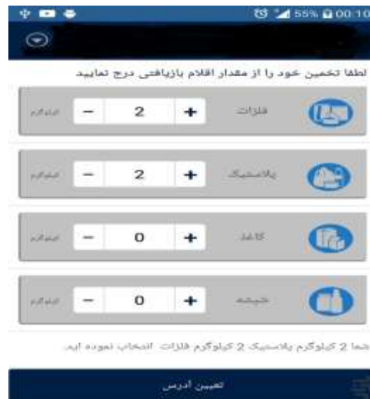
شکل ۴: یک نمونه اپلیکیشن اندروید برای تحویل و مدیریت مقدار پسماند متعلق به کاربر

لایه دولت هوشمند: این لایه، نتایج به دست آمده برای جمع آوری پسماند از مخازن پسماند توسط لایه شهر هوشمند را در یک منطقه خاص مدیریت می کند. اگر ظرفیت کامیون های حمل پسماندهای تفکیکی تا اندازه مورد نیاز یا برآورد شده تکمیل نگردد، وظیفه لایه دولت هوشمند (شهرداری)، ترغیب کاربران یا شهروندان برای پیوستن به تفکیک پسماندها و انتقال آنها به مخازن پسماند تفکیکی است و این وظیفه را از طریق برنامه ریزی پرداخت پاداش به شهروندان (کاربران)، جریمه کردن شهروندان و نیز ایجاد تغییر در قیمت خرید پسماندهای تفکیک شده توسط شهروندان (کاربران) انجام می دهد.