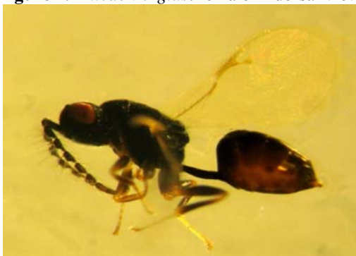
شکل ۳- زنبور پارازیتوئید Eurytoma morio : جنس نر از نمای جانبی.