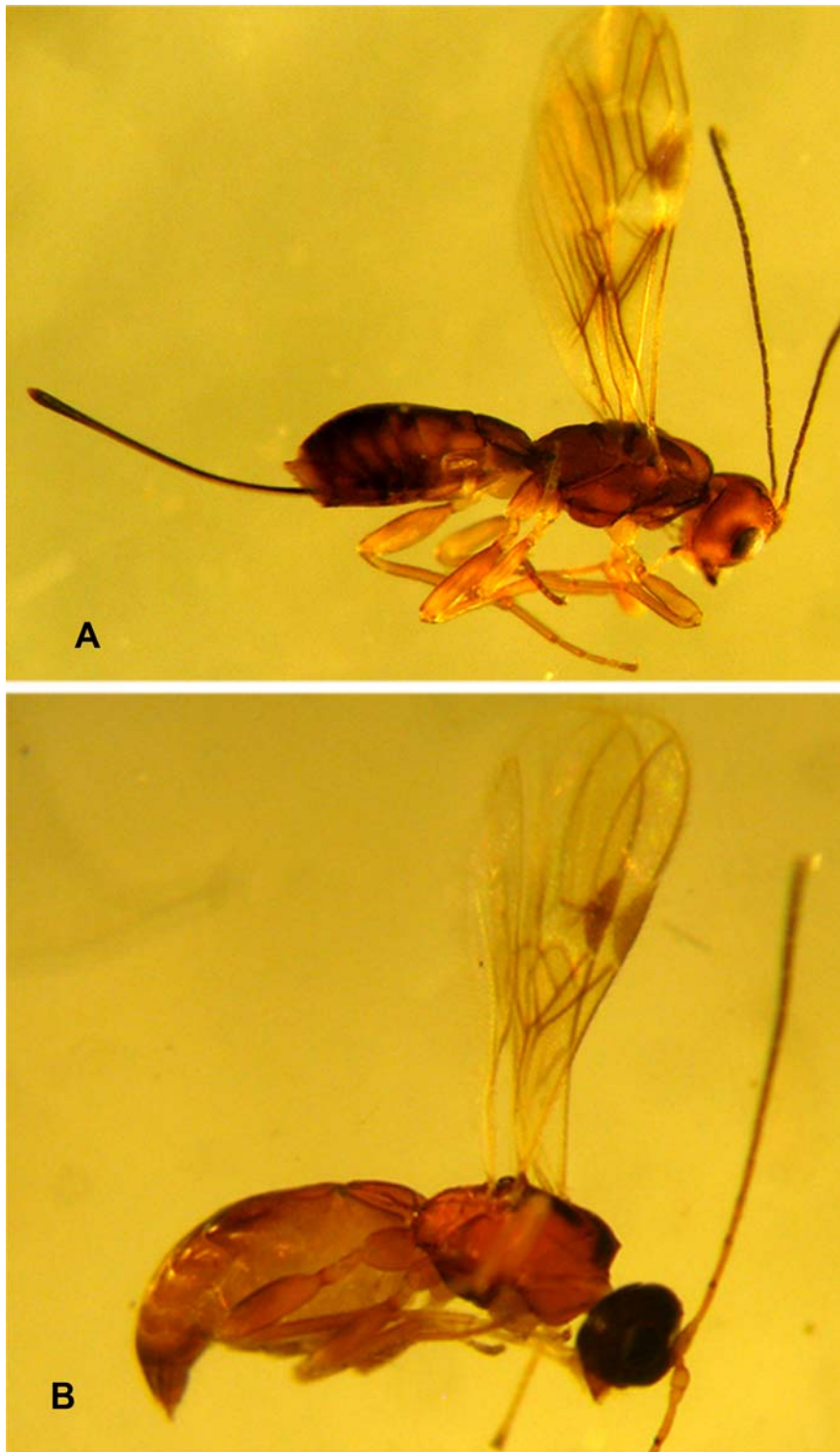
شکل ۱- زنبور پارازیتوئید Dendrosoter middendorffii : A- جنس ماده از نمای جانبی، B- جنس نر از نمای جانبی. Figure 1. Dendrosoter middendorffii : A. Female in lateral view, B. Male in lateral view.