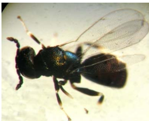
شکل ۲- زنبور پارازیتوئید Entedon ergias : جنس ماده از نمای فوقانی.