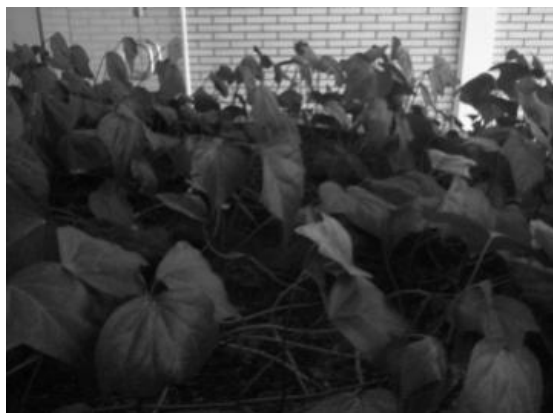
تصویر ۲- محدوده گیاه پایتال

سبزی می‌توانند بهبود دهنده میزان پایداری در فضاهای شهری از طریق کاهش آلودگی هوا باشند" و اگر پاسخ این سوال آری است این امر چگونه و به چه میزانی رخ می‌دهد. هدف از انجام این پژوهش، اثبات و بسط فرضیه بالا در دو مرحله است. در مرحله نخست تمرکز پژوهش بر این است که آیا دیوارهای سبز با پوشش گیاهی خود می‌توانند آلاینده‌های موجود در هوا را جذب نمایند. در مرحله دوم، بررسی‌ها برای تعیین میزان این اثر جذب‌کنندگی است. بر اساس فرضیه مطرح شده، این پژوهش بر آن است تا میزان جذب آلاینده‌های ناشی از سوختن بنزین توسط خودروها در سطح شهر توسط دیوارهای سبز را با آنالیز شیمیایی یک نمونه پوشش گیاهی به انجام رساند. بدین ترتیب با انجام آزمایش‌های پیش رو، مشخص می‌شود که آیا می‌توان دیوارهای سبز را به عنوان راه‌حلی برای کاهش حضور آلاینده‌های ناشی از وسایل نقلیه به‌شمار آورد یا خیر.