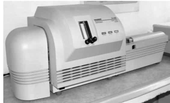
تصویر ۳- دستگاه اسپکتروفوتومتر در آزمایشگاه

علاوه بر آزمایش‌های بالا، یک پوشش گیاهی روی یک دیوار سبز از گیاه یادشده نیز که در سطح شهر قرار داشت برای بررسی دقیق تر مورد آزمایش قرار گرفت (تصویر ۴). انتخاب این پوشش به علت مکان آن (خیابان انقلاب- در محدوده میدان فردوسی) به دلیل تردد بسیار زیاد وسایل نقلیه و نیز همخوانی نوع گیاه با گیاه مورد آزمایش در آنالیزهای قبلی است. در این بررسی براساس روش انجام یافته در مرحله قبل، پنج برگ از قسمت‌های مختلف این پوشش به طور تصادفی انتخاب شد. تعداد بیش تر نمونه ها در این آزمایش به دلیل وسعت بیش تر سطح مورد بررسی است. در این جا همانند آزمایش‌های شیمیایی مراحل قبل، غلظت سولفات و نیترات به روش جذب یو-وی توسط اسپکتروفوتومتر ۱ سنجیده شد و نتایج حاصل از بررسی نمونه سوم برای مقایسه با آزمایش‌های قبل آماده گردید. نمونه سوم به دلیل آن که در سطح شهر و در یکی از مناطق پرتردد شهر قرار داشته به طور طبیعی در معرض دود ناشی از وسایل نقلیه قرار دارد و نیازی به اعمال دود نبود. گیاهان موجود در این پوشش گیاهی از زمان رویش خود در این مکان، در معرض آلاینده های ناشی از خودروها هستند.