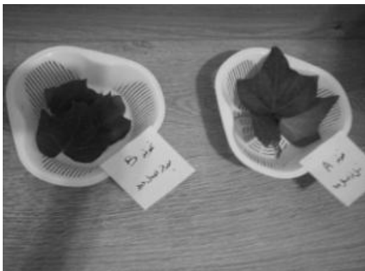
تصویر ۱- نمونه‌های مربوط به قبل و بعد اعمال دود،

جهت اندازه‌گیری سولفات و نیترات جذب شده توسط بافت گیاهی نمونه‌های جمع آوری شده به مدت ۲۴ ساعت در آون ۷۰ درجه سانتی‌گراد قرار داده شد. سپس نمونه‌های خشک شده به صورت پودر درآمده و در ظرف‌های جداگانه با برچسب a (نمونه شاهد) و b (نمونه بعد از اعمال دود) نگه‌داری شد. ۲۵۰ میلی‌گرم از هر نمونه با ۲۰۰ میلی‌لیتر آب مقطر مخلوط شد و به مدت ۲۴ ساعت در آن نگه‌داری شد. سپس مخلوط حاصل از صافی عبور داده شد. ۱۰ میلی‌لیتر از این مخلوط برای آزمایش اندازه‌گیری سولفات معادل ۱۰۰ میلی‌لیتر رقیق گردید. برای اندازه‌گیری نیترات ۵ میلی‌لیتر از محلول اولیه تا میزان ۵۰ میلی‌لیتر رقیق گردید. در نهایت غلظت سولفات و نیترات به روش جذب یو-وی توسط اسپکتروفوتومتر ۲ سنجیده شد.