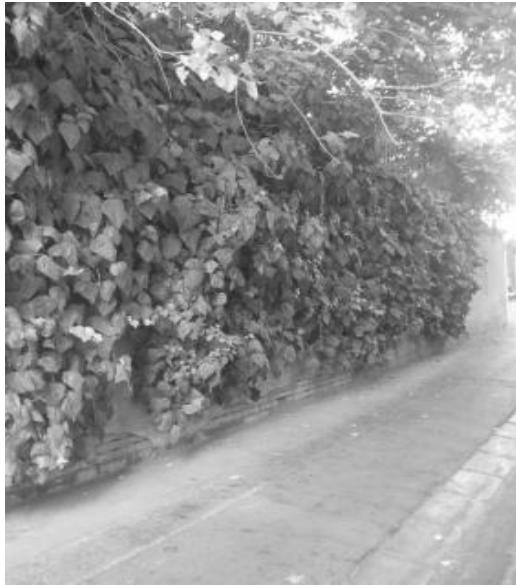
تصویر ۴- دیوار سبز سنتی از گیاه پاپیتال