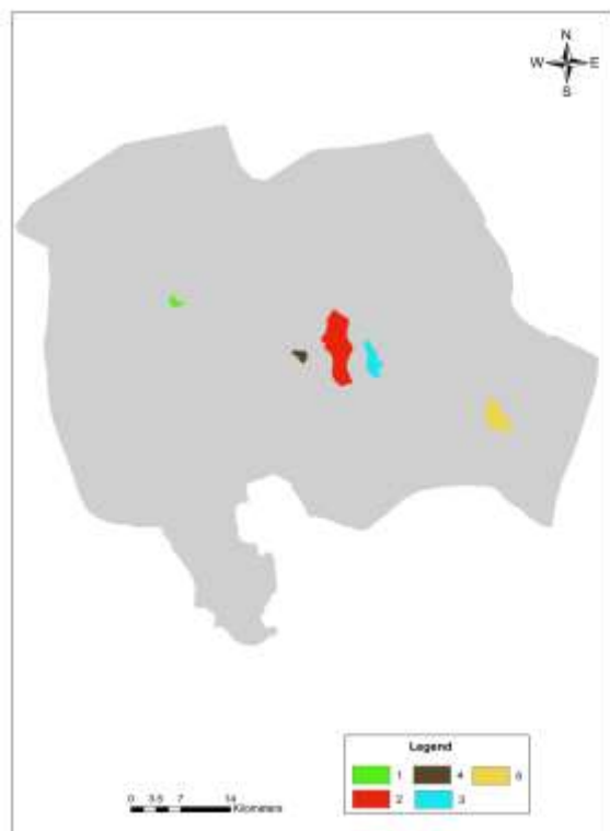
شکل ۲- مناطق مناسب برای دفن مواد زاید جامد