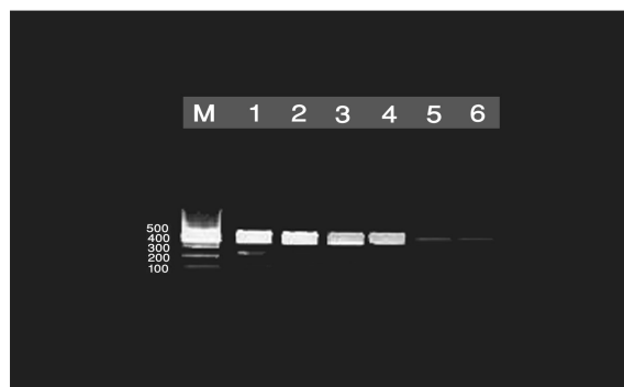
نگاره ۲: تصویر واکنش زنجیره ای پلی مرز حاصل از رقت سازی ستون M سایز مارکر 100bp DNA ladder plus ستون شماره ۱ رقت 10^{-6} - ستون شماره ۲ رقت 10^{-5} - ستون ۳ رقت 10^{-4} - ستون شماره ۴ رقت 10^{-3} - ستون شماره ۵ رقت 10^{-2} - ستون شماره ۶ رقت 10^{-1} که به سختی قابل رویت می باشد.

کرمونسی (cremonesi) و همکاران او در سال ۲۰۰۵ جهت تشخیص استافیلوکوکوس ارئوس در فرآورده های شیری از ۱۱ جفت پرایمر به روش Multiplex PCR استفاده کردند.