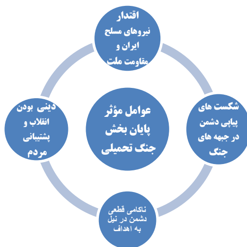
نمودار ۳- مدل مفهومی عوامل مؤثر در پایان یافتن جنگ تحمیلی

سؤال فرعی دوم: دلایل پایان یافتن جنگ تحمیلی کشور عراق علیه ایران، چه دلایلی بود؟ در پاسخ به دومین سؤال فرعی تحقیق، در بخش ادبیات نظری به حد کفاف مطالبی بیان شد و تبیین گردید که چهار عامل اصلی موجب شد که دشمن مهاجم که هر روز در یکی از جبهه‌های جنگ متحمل شکستی تازه می‌گردید، با توسل به هر وسیله و دستاویز ممکن، ملتمسانه پایان جنگ را به صورت صلح یا آتش بس خواستار شده بود و جمهوری اسلامی ایران نیز با توجه به محاسبات راهبردی ملی خود، قطعنامه ۵۹۸ سازمان ملل را برای قبول آتش بس پذیرفت؛ لذا در اینجا مدل مفهومی عوامل پایان جنگ در نمودار ذیل ارائه می‌گردد: