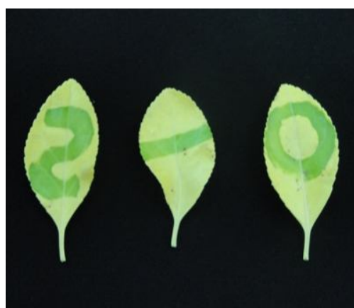
شکل ۱: سبز شدن قسمت‌هایی از برگ زرد که با فویل پوشانده شده بودند.

جدول ۳: تجزیه واریانس فاکتورهای مورد بررسی