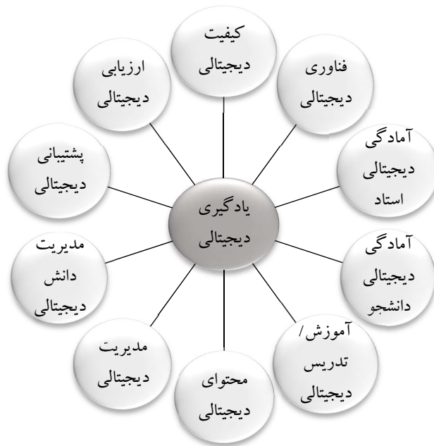
مدل مفهومی یادگیری دیجیتالی

مدیریت جنبه‌های مالی {۴}؛ آمادگی مالی {۵۸}؛ آمادگی‌های مالی میزان بودجه و سرمایه‌گذاری {۵۵}؛ عامل دیجیتالی اقتصادی (تخصیص اعتباری، تجهیز دانشگاه و) {۵۴} فراهم کردن تسهیلات برای منابع فلسفه- بیان مأموریت و اهداف- سیاست و خط‌مشی‌ها {۲۳}، تعیین سیاست‌ها و دستورالعمل‌های مربوط به آموزش آنلاین {۴}؛ بازسازی نقش و مسئولیت‌های مدنی {۲۱}؛ آمادگی سیاست آموزشی {۵۸}؛ آمادگی قوانین {۵۸}؛ قوانین حمایتگر {۵۴}؛ استانداردهای اعتباربخشی {۲۱} تخصیص بودجه {۱۶} منابع مالی {۸۰} {۴۲}؛ خود یادگیری- ایجاد فرهنگ خود یادگیری {۳۴} زیرساخت‌های فرهنگی {۵۵} اشاعه فرهنگ آموزش مجازی {۵۴}؛ عوامل اجتماعی و فرهنگی {۵۴}؛ خدمات {۶۰} {۴۳}، حمایت مالی {۵۷}، فرهنگی و اجتماعی {۵۷}، خودکارآمدی و سودمندی {۵۷}، پاسخ‌دهی {۵۷}، سازمان‌دهی مناسب {۵۷}، مدیریت و رهبری {۵۹}، استانداردها {۵۹} فرهنگی، اجتماعی، اقتصادی بوروکراسی و مدیریت، رهبری و مدیریت {۱۶}، چشم‌انداز روشن و رهبری قوی {۱۶} کارایی {۴۳} {۳۶}، مهارت‌ها و چشم‌انداز {۲۸} مدیریت تغییر {۱۱}، مدیریت چابک {۱۱} توسعه ظرفیت رهبری {۹} زیرساخت‌ها و استانداردهای مناسب {۱۶}، کار تیمی {۱۶}، نقش‌ها و مسئولیت‌ها {۱۶}، سازگاری {۴۳} مالی {۱۶}، مدیریت و استفاده از اطلاعات دانشجویی {۴۶}؛ نقش‌ها {۳۸} حوزه مدیریتی {۱۳}، اداره و مدیریت {۱۳} در دسترس بودن میز راه‌ها {۲۵} مدیریت سازمان {۹} مهارت‌های مدیریت و رهبری {۴۱}