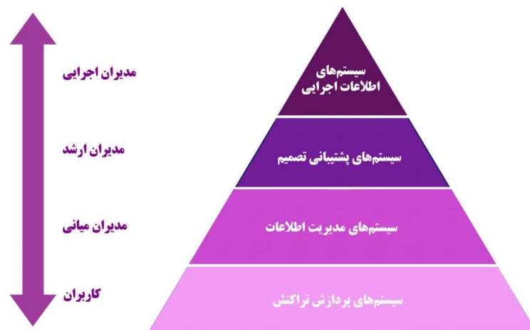
نمودار (۱) انواع سیستم‌های اطلاعاتی در سازمان

در حالی که چندین نسخه مختلف از مدل هرم سیستم‌های اطلاعاتی وجود دارد رایج‌ترین مدل، مدل چهار سطحی است که بر اساس افرادی که از سیستم‌ها استفاده می‌کنند سطح‌بندی می‌شود. اساس طبقه‌بندی، افرادی هستند که از سیستم‌های اطلاعاتی استفاده می‌کنند و بدان معنی است که بسیاری از ویژگی‌های دیگر مانند ماهیت کار و الزامات اطلاعاتی، کم و بیش به طور خودکار از حساب کاربری گرفته شده است.