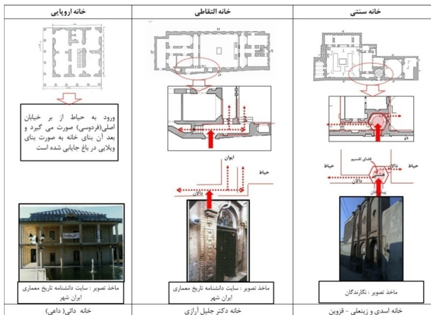
جدول ۷. مقایسه روند تغییر ورودی در خانه‌های قاجاریه قزوین

دوره قبل از ناصری - ناصری و بعد از ناصری شکل گرفتند. گاه در یک دوره می‌توان هر سه سبک را مشاهده کرد. به همین دلیل ۱۰ نمونه از خانه‌های شهر قزوین به‌منظور بررسی تغییر الگوهای حریمیت در راستای تغییرات فرهنگی مورد بررسی و تحلیل قرار گرفته‌اند (۵ نمونه شاهد در مقاله آورده شده است).