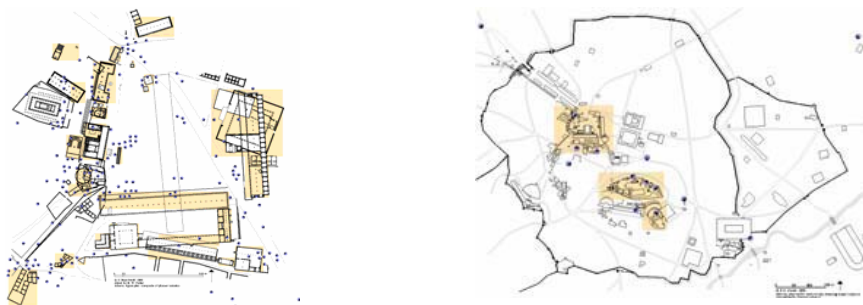
تصویر شماره ۱- نقشه آتن و آگورای آن در قرن پنجم قبل از میلاد (Neelsmith, 1989)