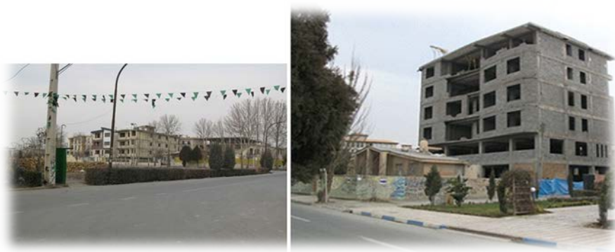
شکل ۲. الگوی غالب آپارتمان سازی در مهرشهر

جمعیت فازهای ۱، ۲ و ۳ که مبنای ارزیابی این تحقیق قرار داشته‌اند، بالغ بر ۹۰ هزار نفر تخمین زده شد. نتایج حاصل از پرسش‌نامه‌ها با استفاده از نرم افزار SPSS، مورد تحلیل و ارزیابی قرار گرفت. علاوه بر سنجش روایی سوالات، جهت سنجش پایایی نیز، با توجه به مقیاس رتبه‌ای داده‌ها و برخورداری آنها از توزیع نرمال، از روش محاسبه