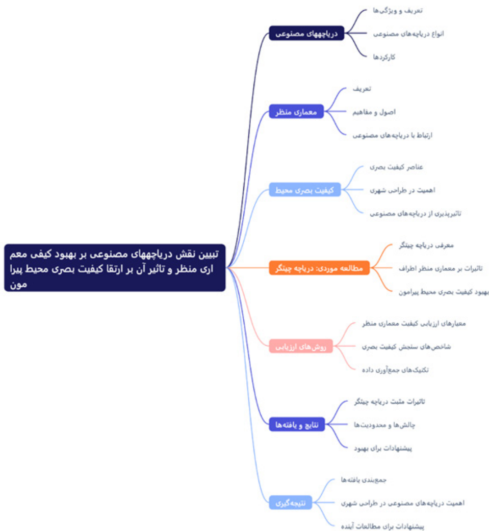
شکل ۲. مدل تحلیلی شاخص و معیارهای بررسی شده Figure 2. Analytical model of the index and reviewed criteria