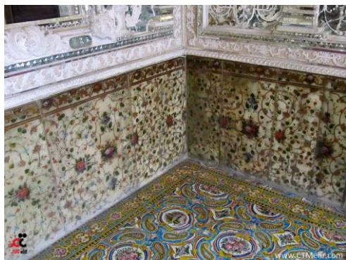
تصویر شماره ۱- واقع گرایی در تصاویر گیاهی، کاخ شمس العماره تهران، (مأخذ: www.google.com)