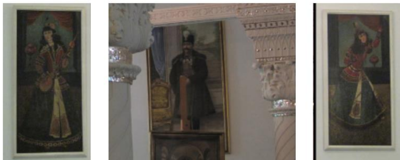
تصویر شماره ۸- تک چهره‌های تالار حوضخانه صاحبقرانیه، (مأخذ: محمدی حاجی آبادی و دیگران، ۱۳۹۲: ۵۰).

است. (تصویر ۸) با وجود اینکه هیچ کدام از تصاویر دقیقاً مانند یکدیگر نیستند، اما در کل مجموعه منسجمی را به وجود آورده اند، به طوری که ذهن انسان شکاف بین طرح‌ها را پرها کند.