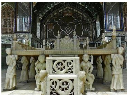
تصویر شماره ۴- کاربرد مجسمه در عمارت تخت مرمر کاخ گلستان، (مأخذ: قبادیان، ۱۳۸۳: ۱۲۲)