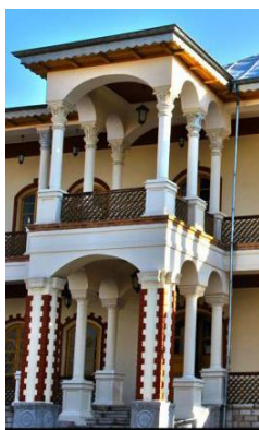
تصویر شماره ۵- سردر ورودی قصر یاقوت (مأخذ: www.google.com )