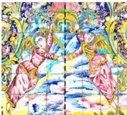
تصویر شماره ۲- واقع گرایی در تصاویر انسان و حیوان، کاخ گلستان، (مأخذ: پنجه باشی و فرید، ۱۳۹۶: ۵۲۴)