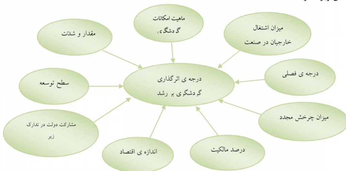
شکل ۱: عوامل مؤثر در درجه‌ی اثرگذاری گردشگری بر رشد اقتصادی کشور میزبان

ایجاد اشتغال، کسب درآمد ارزی برای کشور میزبان و بهبود تراز پرداخت‌ها، افزایش درآمدهای مالیاتی از محل فعالیت‌های اقتصادی مرتبط با گردشگری، ایجاد تعادل منطقه‌ای، تعدیل ثروت، دگرگون ساختن فعالیت‌های اقتصادی و سوق دادن درآمد، از مناطق شهری به روستاها و بالاخره جلوگیری از برون کوچی روستاییان می‌تواند از جمله اثرات اقتصادی گردشگری باشد (صدر موسوی و دخیلی، ۱۳۸۴: ۱۳۹). البته تأثیر گردشگری بر رشد اقتصادی کشور میزبان از طریق برخی عوامل تعدیل می‌گردد که به این عوامل در شکل زیر اشاره شده است.