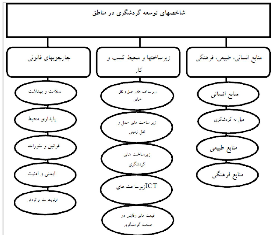
شکل ۲- خلاصه ساختار فهرست شاخص‌ها (کریم‌زاده و همکاران، ۱۳۹۳: ۲۷۴)

مستقل، با صنعت گردشگری ارتباط مستقیم دارند. بنابراین ایجاد فرصت‌های شغلی از سوی صنعت گردشگری بسیار حائز اهمیت است، به طوری که در حال حاضر در سطح جهانی حدود یک سوم مشاغل خدماتی به صورت مستقیم و غیرمستقیم در اختیار صنعت گردشگری می‌باشد. لذا هر کدام از این فعالیت‌ها در بخش گردشگری به عنوان فرصت کارآفرینی می‌تواند مطرح باشد. مجمع توسعه اقتصادی سازمان ملل سه شاخص عمده‌ای که منجر به توسعه کارآفرینی در بخش گردشگری مناطق می‌گردد را به این صورت طبقه‌بندی کرده است: (۱) منابع انسانی، فرهنگی و منابع طبیعی مربوط به گردشگری؛ (۲) زیرساخت‌ها و کسب و کار؛ (۳) چارچوب قانونی و نظارتی مربوط به گردشگری (شکل ۲).