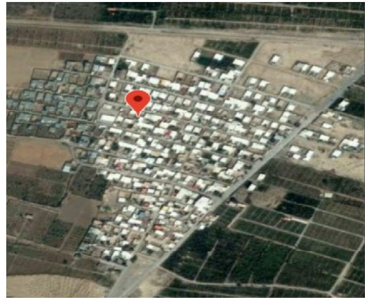
شكل شماره ۱: نقشه ماهواره‌اى روستاى قردين