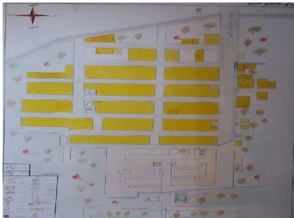
شكل شماره ۲: شماتيك روستاى قردين

قردين در ۳۷'' ، ۱۷' ، ۵۰^{\circ} تا ۳۶'' ، ۲۹' ، ۵۰^{\circ} شرقی و ۲۴'' ، ۵۶' ، ۳۴^{\circ} تا ۳۴'' ، ۰۰' ، ۳۴^{\circ} شمالی در ۱۰ كيلومترى جنوب ساوه و ۱۲۵ كيلومترى جنوب غربى تهران در بخش مركزى، در دهستان نوعلى بيگ شهرستان ساوه به امر كيخسرو ساخته شده است. آورده‌اند چون به كوه انديس و ماهين رسيد دستور به ساخت بنا داد و چون به اوامر خود گفت: "كرديد اين" به مرور زمان به قردين تغيير نام يافته است (قمي، ۱۳۶۱: ۸۱) (شكل شماره ۱ و ۲).