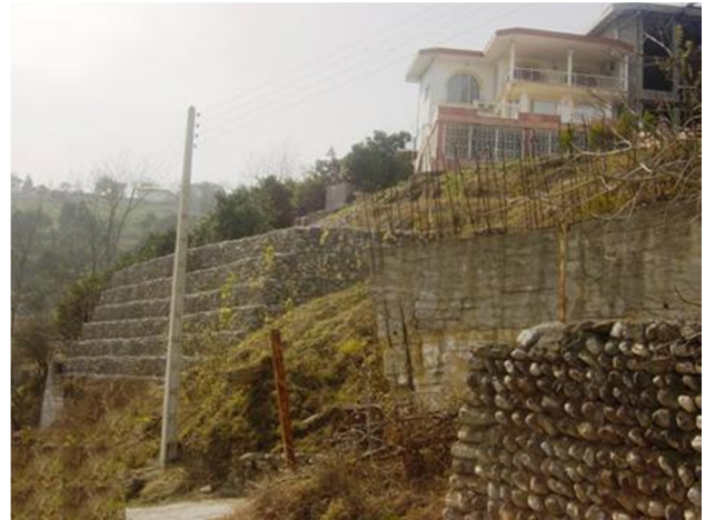
عکس (۲): ناپایداری زمین و اقدامات حفاظتی ساختمان‌ها در روستای لرسانور