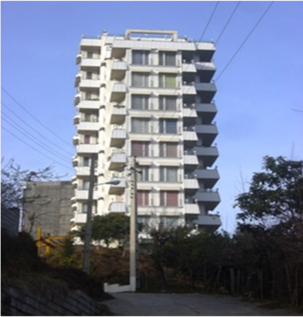
عکس (۳): برج آرامش در روستای ارباکله