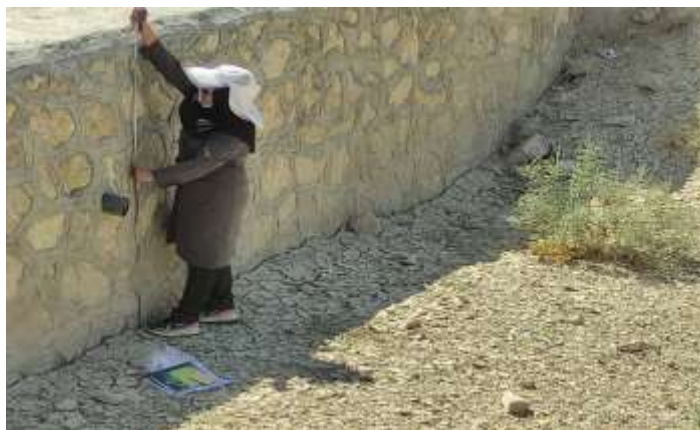
شکل (۳): اندازه‌گیری ارتفاع رسوبات ته‌نشین شده پشت بند اصلاحی

پس از بررسی میدانی و بازدید از محل بندهای اصلاحی در حوزه آبخیز، ۱۱ بند برای مطالعه انتخاب شدند. جدول ۱ موقعیت جغرافیایی بندهای اصلاحی انتخابی، سال ساخت و ابعاد آنها را نشان می‌دهد. در انتخاب بندهای اصلاحی دقت کافی صورت گرفته است تا بندها از رسوب پر نشده باشند، در داخل زیرحوضه‌ها پراکنده و شاخصی از انواع بندهای موجود (گابیون، سنگ ملاتی) در حوضه باشند. نمونه‌های رسوب از عمق صفر تا ۳۰ سانتی متری از پشت هر بند اصلاحی جمع‌آوری شد. به منظور گرفتن یک نمونه کاملاً شاخص و معرف، هر نمونه شامل ۳ نمونه کوچک‌تر است که از سه مکان مختلف پشت بندهای اصلاحی گرفته شده است. به منظور جلوگیری از اختلاط نمونه‌های رسوب پشت بند با خاک‌های اطراف، سعی شده است که رسوبات از کناره‌های بندهای اصلاحی جمع‌آوری نشود. شکل ۳ اندازه‌گیری ارتفاع رسوبات ته‌نشین شده در پشت بند اصلاحی را نشان می‌دهد.