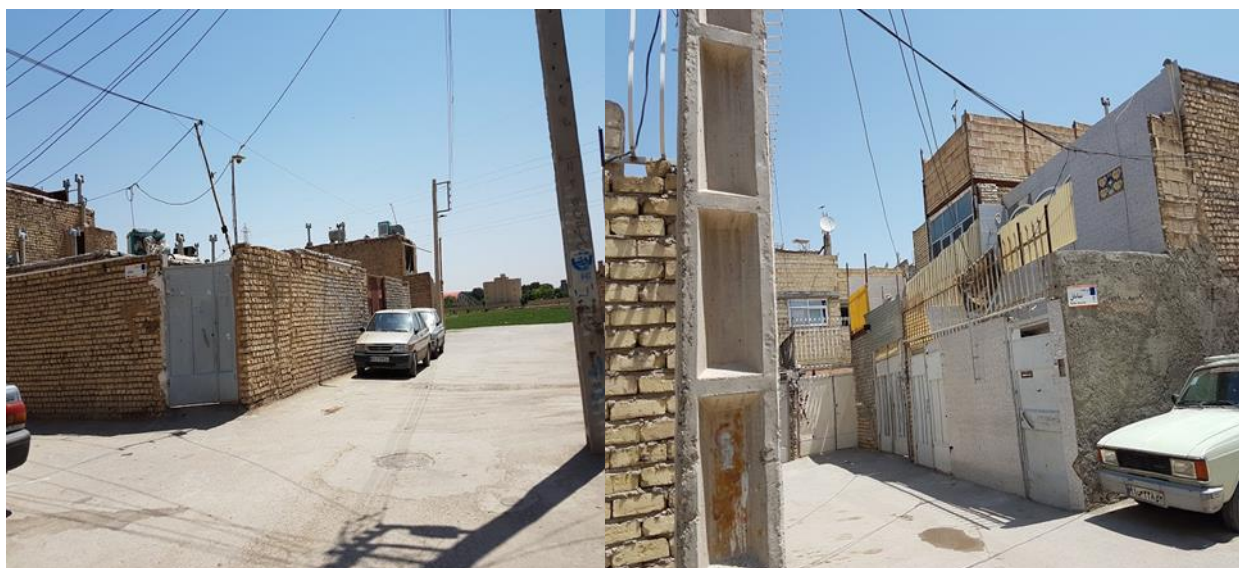
شکل (۲): وضعیت کالبدی مسکن در سکونتگاه های غیر رسمی منطقه ۱۴ اصفهان، مأخذ: برداشت های میدانی پژوهشگران، ۱۳۹۸

جدول (۷): برآورد آزمون t تک نمونه‌ای جهت مقایسه معنی داری هر یک از عوامل در پرسشنامه تاثیر بر کیفیت و رفاه شهروندان بر مبنای زیست پذیری شهری