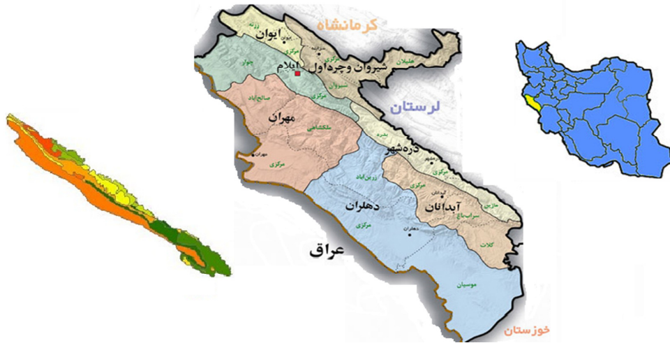
شکل (۱): موقعیت جغرافیایی شهرستان دره شهر در کشور و استان