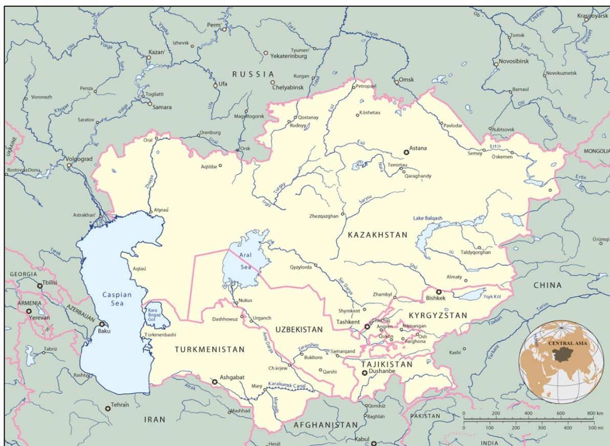
نقشه ۱: موقعیت جغرافیایی آسیای میانه

آسیای مرکزی یا آسیای میانه سرزمین پهناوری در قاره آسیا است که هیچ مرزی با آب‌های آزاد جهان ندارد. اگر چه مرزهای دقیقی برای این سرزمین تعریف نشده است، اما معمولاً آن را دربرگیرنده کشورهای امروزی، ازبکستان، تاجیکستان، ترکمنستان، قزاقستان، قرقیزستان می‌دانند.