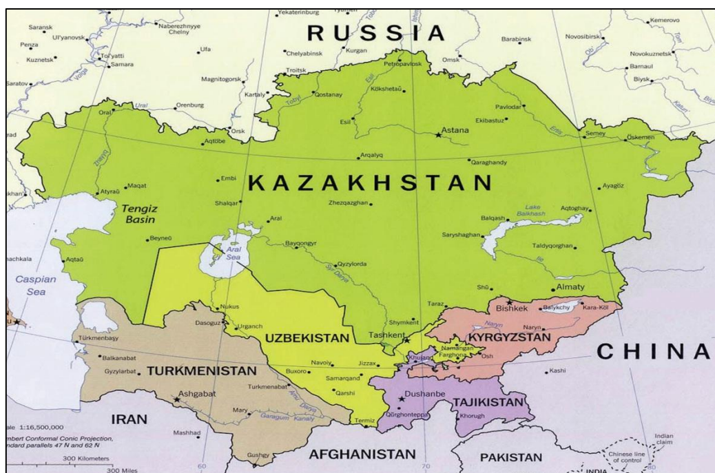
نقشه شماره ۲: کشورهای منطقه آسیای میانه