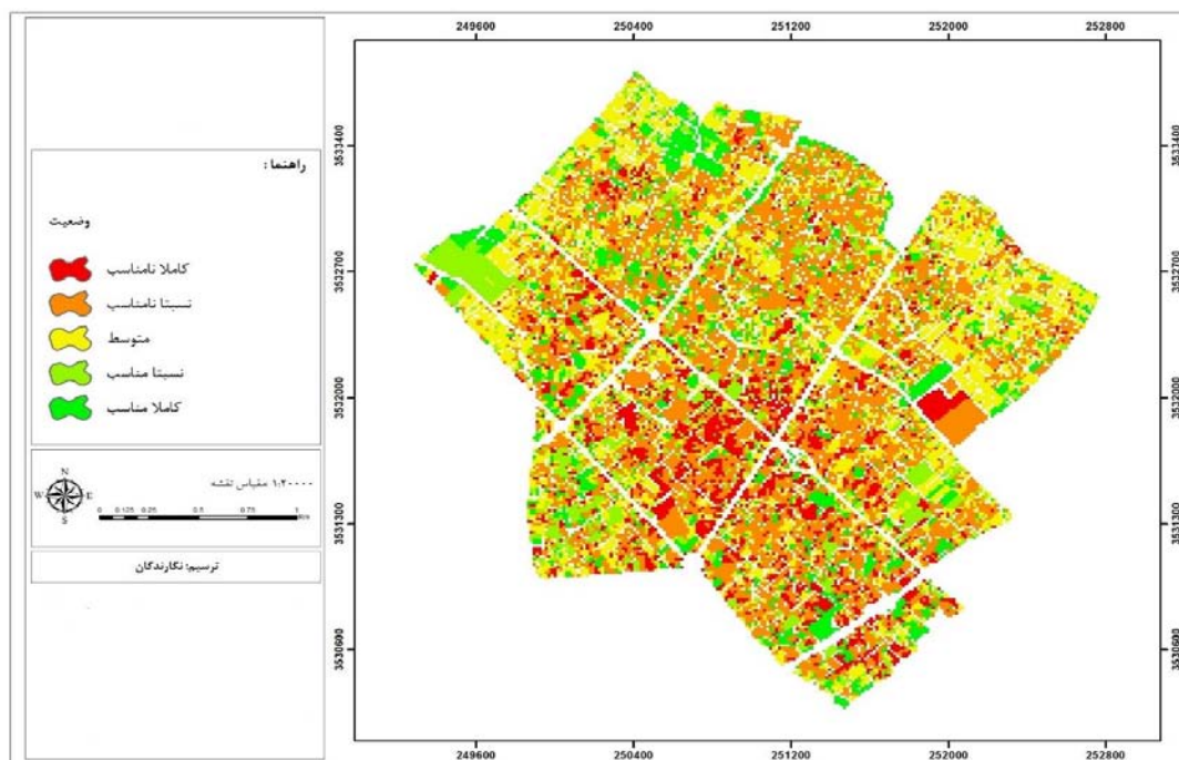
نقشه ۲: میزان تاب‌آوری بافت تاریخی شهر یزد با استفاده از شاخص‌های کالبدی