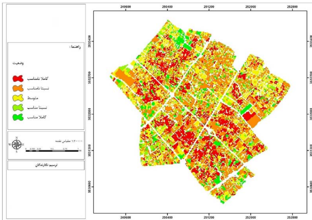
نقشه ۳: تحلیل سلسله‌مراتبی شاخص‌های تاب‌آوری در بافت تاریخی شهر یزد

حداقل زمان به بازیابی فعالیت‌ها پرداخته و شهر، پایداری و پویایی خود را بازیابد. در غیر این صورت شاهد ویرانی فزاینده شهر خواهیم بود.