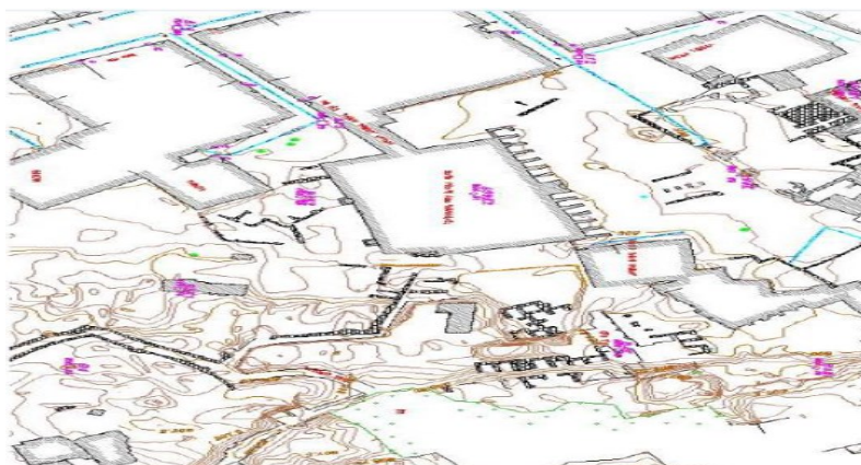
شکل (۲)، عکس هوایی شهر تاریخی دهدشت

شهر تاریخی دهدشت در ضلع جنوبی شهر دهدشت استان کهگیلویه و بویراحمد قرار دارد و با این که در سال ۱۳۶۴ در فهرست آثار ملی ایران ثبت شده، هنوز بعد از گذشت سه دهه، اقدامات لازم برای حفظ و نگهداری آن انجام نشده است. این شهر با وسعتی بیش از ۳۵ هکتار، به عنوان یکی از بزرگترین محوطه های باستانی کشور، شناخته می شود. البته برخی از محققان تاریخی معتقد هستند که مساحت اصلی آن، حدود ۶۰ هکتار بوده است. اما به دلیل انجام نشدن اکتشافات باستان شناسی در این منطقه، هنوز بخش هایی از این شهر باستانی زیر خاک مدفون است و درستی این نظریه، ثابت نشده است. بنای اولیه این شهر، که به دلیل وجود ۷ امامزاده در اطرافش، به شهر هفت گنبد مشهور است، مربوط به اوایل دوره ساسانی است. برخی، دستور ساخت آن را به اردشیر اول نسبت می دهند و برخی دیگر معتقد هستند که شاپور اول، فرزند اردشیر اول، دستور ساخت این شهر را داده است. اما تمامی مورخان در این مطلب اتفاق نظر دارند که سابقه سکونت در این منطقه از ابتدای دوره ساسانیان، فراتر نمی رود. آثار معماری این شهر کهن علاوه بر امامزاده ها شامل برج و باروی گرداگرد شهر، باروی قلعه یا ارگ قدیمی آن با مساجد، حمام ها، آب انبار، کاروانسرا، بازار و گورستان در مجاورت دروازه های شرقی و غربی پیرامون بناها می باشد.