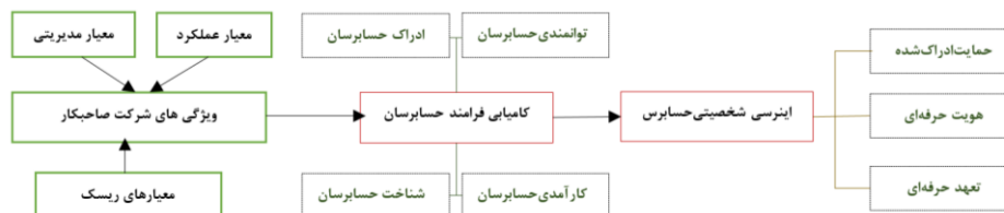
شکل (۳) چارچوب نظری پژوهش

براساس ابزار پژوهش چارچوب نظری به ترتیب زیر ارائه شده است، که طبق توضیح‌های داده شده این چارچوب نظری اقتباسی و مبتنی بر پرسشنامه‌های شیننده و همکاران (۲۰۱۳) برای سنجش کامیابی فرامند و سالوو (۲۰۱۷) برای سنجش اینرسی رفتاری حسابرسان می‌باشد.